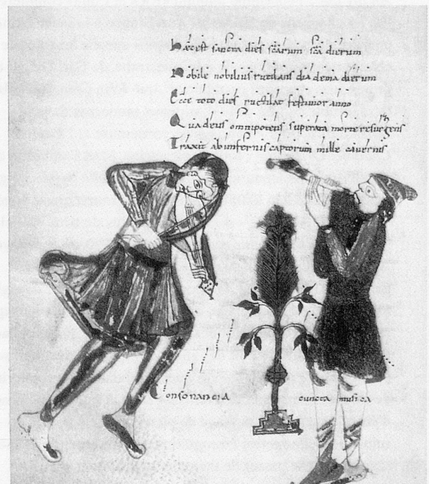
Manuscrit du XIII e siècle