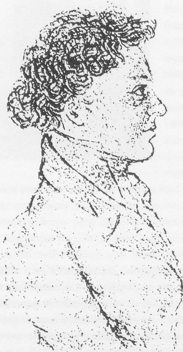
Schubert à l'âge de 17 ans (dessin de Franz von Schober)