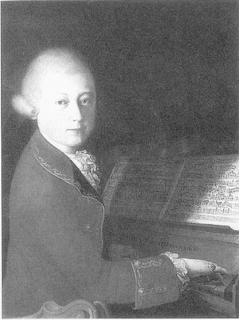
Mozart au piano

buffa . Tout en récoltant des critiques virulentes, Haydn développa une construction formellement rigoureuse à partir de tels contrastes expressifs,