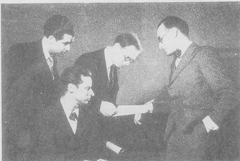
Le groupe de la Jeune France lors de sa fondation.

BOULEVARD DE LA LIBÉRATION 17 LOCERNE FESTIVAL