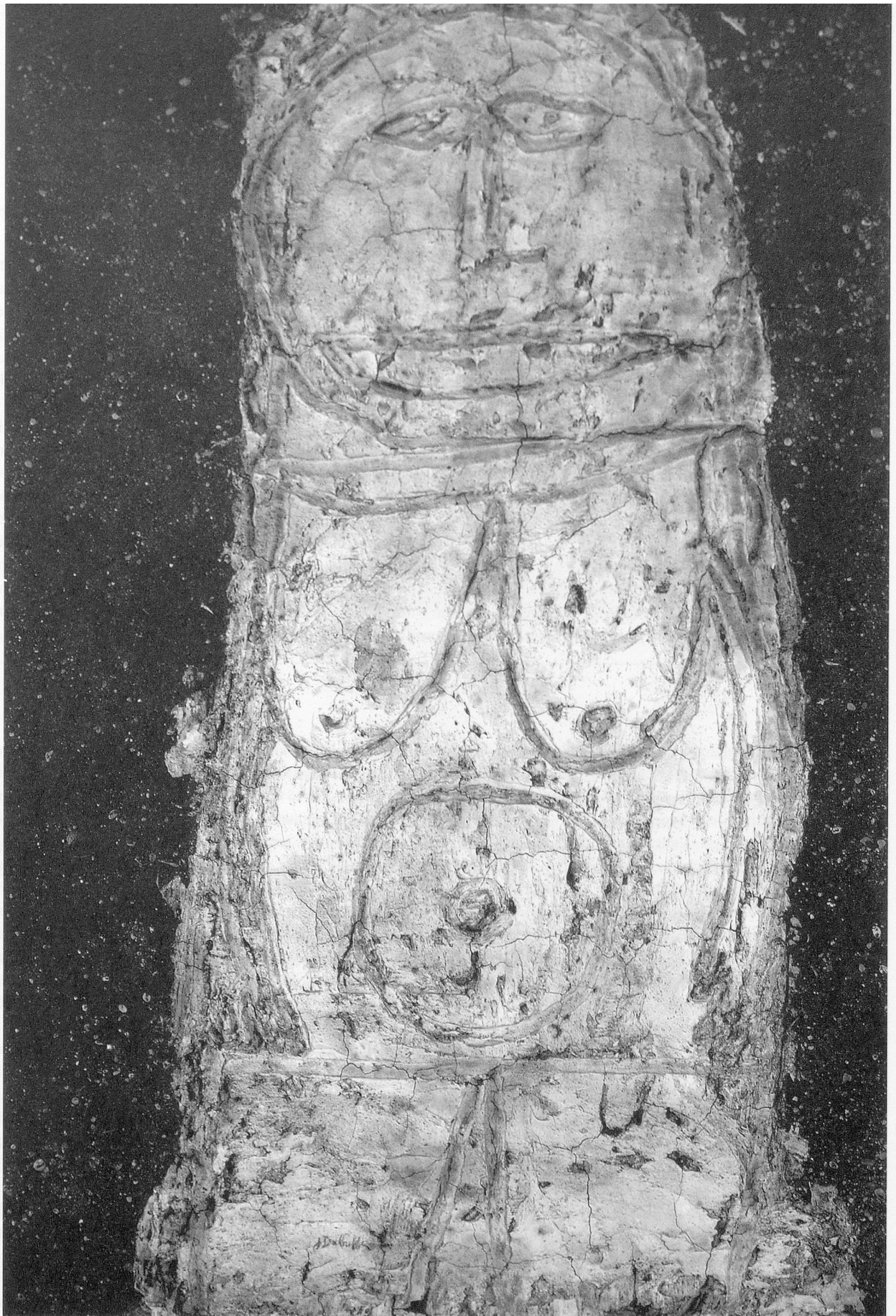
Abbildung 4: Jean Dubuffet; «Vénus du trottoir» (1946) Öl auf Stuckplatte, 102x82 cm, «Catalogue des travaux de Jean Dubuffet», elaboré par Max Loreau, Fascicule II, Lausanne 1964, No. 144, Musée Cantini, Marseille (ehemals in Besitz von Georges Limbour).