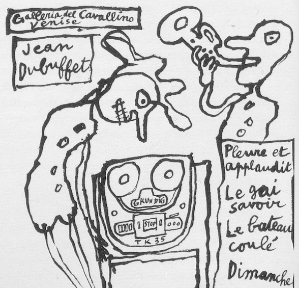
Abbildung 1: Jean Dubuffet, Plattencover «Expériences musicales» (1961)