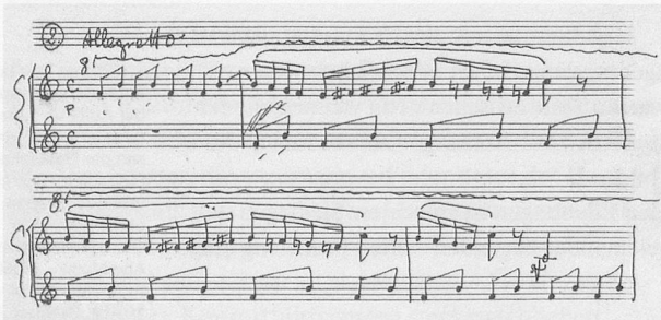
Début de l'« Allegretto » des quatre petites pièces pour piano de 1941 23 .

Cher Monsieur Ligeti, le travail d'archivage est fort heureusement l'affaire de la musicologie. Du tréfonds des archives, voici donc retrouvé cet Allegretto , extrait de quatre petites pièces pour piano de 1941, premier exemple de style mécanique :