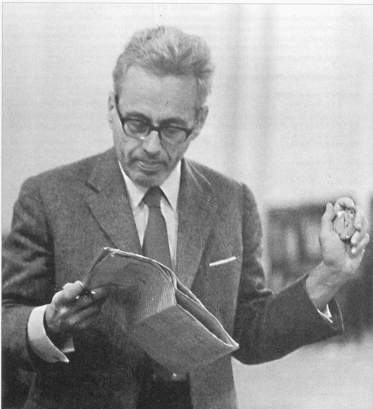
György Ligeti en 1968, chronométrant intérieurement les « Dix pièces pour quintette à vent ».

Enquête sur les liens entre l'œuvre et la biographie du compositeur hongrois