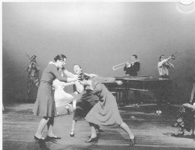
Szene aus Wolfgang Floreys «WAHR.HAFT.ICH»

Ultraschall, Eclat, MaerzMusik: Bemerkungen zu den gut besuchten Frühjahrs-Festivals in Berlin und Stuttgart