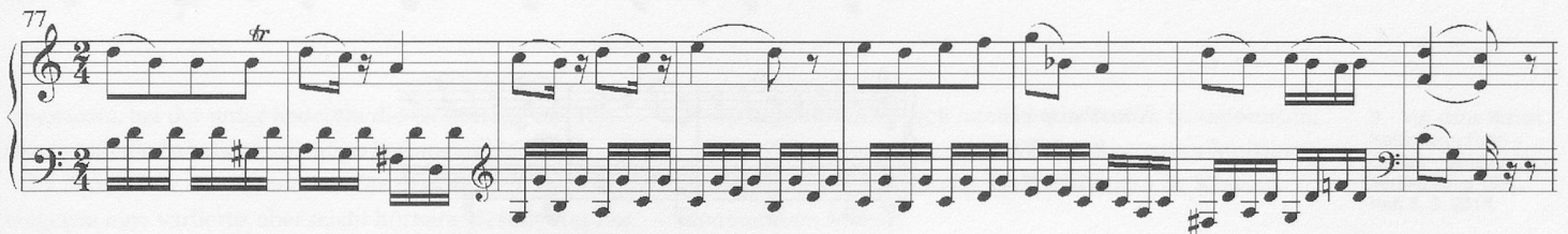
Notenspiel 3: Variante Kelterborn

Dieser feine, charmante Witz verliert natürlich beim zweiten Mal (also bei der Wiederholung der Exposition) seinen Reiz – also lässt man die Wiederholung doch besser weg!