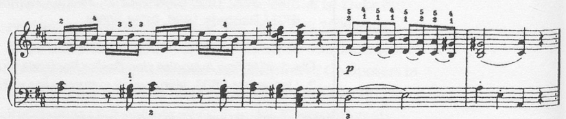
Notenbeispiel 1: Sonate KV 311 / I, Takt 36-39

In der neueren Musik, keineswegs nur in der Zwölfton- und in der seriellen Musik, sind Wiederholungen von grösseren Abschnitten alles andere als üblich. Schon deshalb sollte man bei historischen Musikstücken immer wieder darüber nachdenken, ob eine vorgeschriebene Wiederholung musikalisch absolut notwendig, ob sie zwar sinnvoll aber durchaus nicht unverzichtbar, oder ob sie für die Komposition vielleicht sogar «schädlich» ist. Beim ersten Satz der Klaviersonate D-Dur KV 311 würde ich zum Beispiel die Exposition auf keinen Fall wiederholen. Diese Exposition endet mit einem hübschen Einfall, einem kleinen Seufzer-Motiv, das der kräftigen Abschluss-Kadenz überraschenderweise angehängt wird ( Notenbeispiel 1 ).