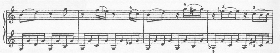
Notenbeispiel 4: KV 330/III, Takt 77-93