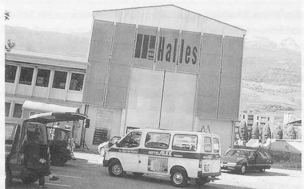
Wohltuend unpoliert: Les Halles in Sierre, einem Hauptspielort des «forum wallis», davor «A carisa carisa car».

Das Festival «forum :: wallis <<>> forum :: valais» in Sierre und Leuk (7.–15. September 2007)