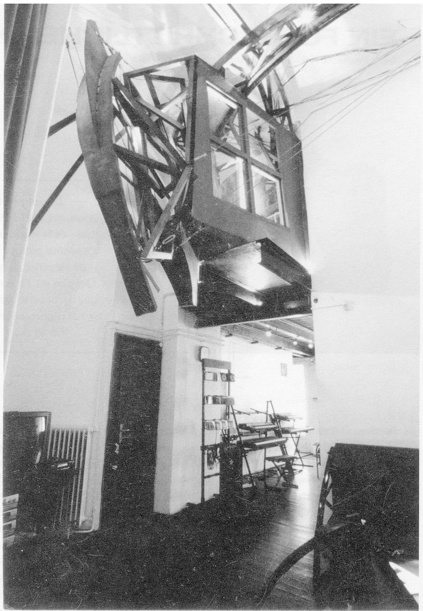
Im Budapest Music Center.

Orchester in unser Haus aufnehmen. Auf jeden Fall verspricht es, eine sehr aufregende Sache zu werden.