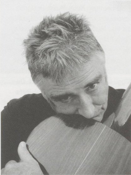
Fred Frith