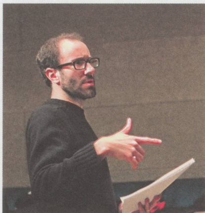
Felix Profos

Auf jeweils unterschiedliche Weise steht der Schweizer Komponist Felix Profos im Mittelpunkt zweier neuer, ausserordentlich starker CD-Produktionen. Der schlichte Titel PROFOS lässt nichts davon erahnen, wie die Schlagzeuger Lucas Niggli und Peter Conradin Zumthor, beide musikalisch in Rockmusik und (Free) Jazz beheimatet, sich dem Ersten und Zweiten Tanz (2008/09) von Profos annähern. Die extrem schwierig zu spielenden Stücke zeichnen sich durch eine hohe Komplexität rhythmischer Ereignisse aus, deren Klangergebnis allerdings zugleich von einer fast rituell anmutenden Strenge zeugt. Genau daraus resultiert auch ihre besondere Wirkung: Die Musik verunsichert, weil sie das Gefühl vermittelt, dass hier eine Ordnung zugrunde liegt, obgleich man bei der hörend vollzogenen Suche nach Ordnungskriterien scheitert und sich die wahrnehmbaren Loops, Pulsketten oder klanglichen Veränderungen keinem Schema beugen wollen. Dieses Moment der Irritation macht die Faszination aus, die – zusammen mit einer gewissen