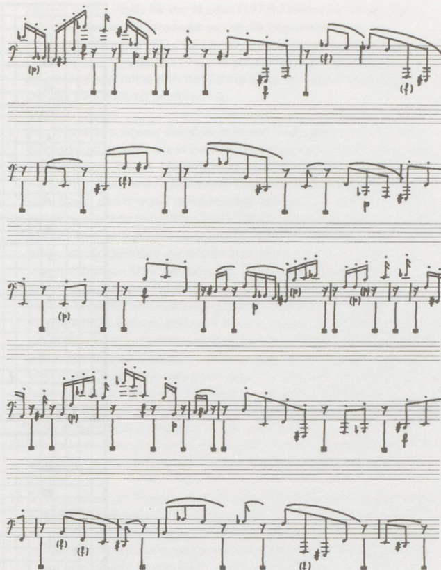
«Mutmassung über Agis» (1995) für 1 tiefes Instrument (S. 2). www.aart-verlag.ch