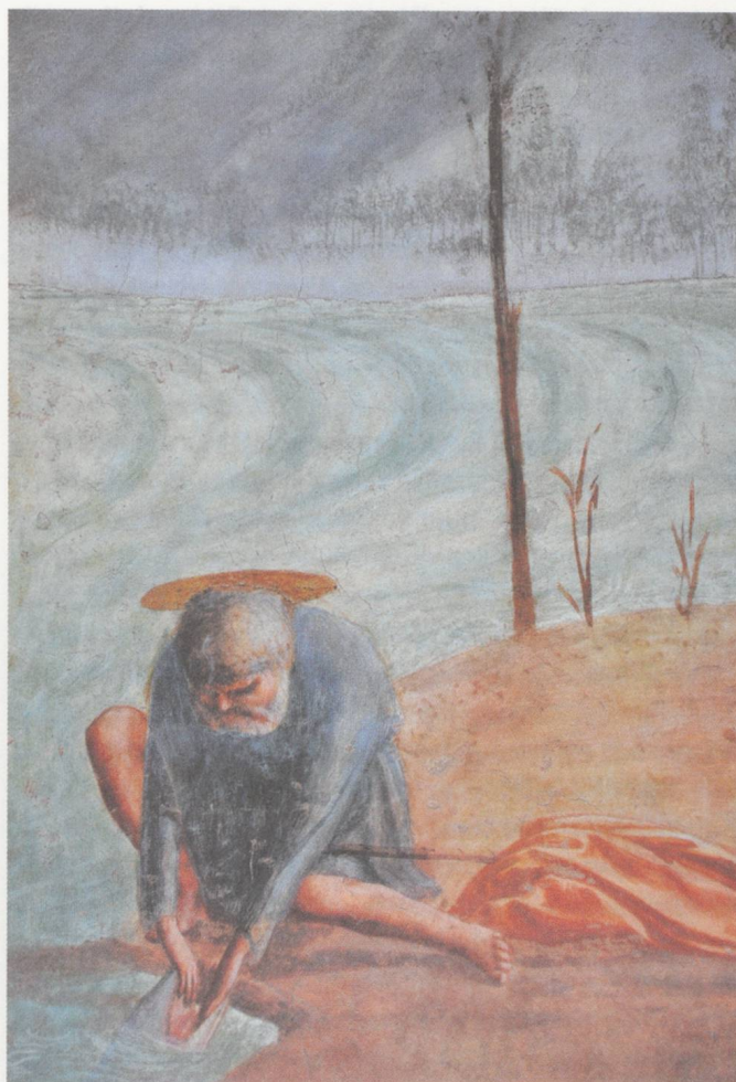
Tommaso di Giovanni Cassai, dit Masaccio, détail de la chapelle Brancacci issu du « Paiement du tribut » (1424–1428).

Par delà l'anecdote, la contemplation du ciel ne saurait se réduire à une préoccupation personnelle, chère au cœur du compositeur et sans influence sur l'œuvre : dès 1933, Luigi Dallapiccola questionne l'origine de la lumière dans la littérature même, telles ces notes prises dans le volume des Frères Karamazov 14 . L'une fait allusion à Joyce que le musicien découvre alors, l'autre signale : « concezione de la luce » et