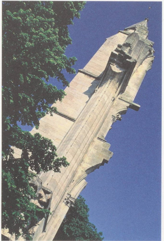
La tourelle de l'ancienne église, Abbaye de Royaumont. © Olivier Michel

En plus du travail « interne » menant aux deux concerts des étudiants (avec l'Ensemble Recherche, le Quatuor Xasax, les Cris de Paris et Geoffroy Jourdain, le 24 septembre), l'Abbaye offre un panel de concerts variés, où les étudiants sont évidemment invités. On mentionnera par exemple un samedi Xenakis et Stockhausen (10 septembre) ; la remise sur pied du ballet La Merlaison de Louis XIII de 1635 (17–18 septembre), où la compagnie L'Éclat des Muses, dans une chorégraphie de Christine Bayle et scénographie de Thierry Bosquet, le tout dirigé par Patrick Blanc, a rendu avec une fraîcheur et une étrangeté étonnante le monde perdu d'un Ancien Régime florissant ; un vif concert Schumann avec les Cris de Paris et Geoffroy Jourdain (17 septembre) ; une performance remarquable et inspirée de Wilhem Latchoumia où Cage côtoyait une pléthore de créations (Blondeau, Naegelen, Mincek, Bianchi, Pesson, Filidei, Jodlowski, le 24 septembre) ; enfin (25 septembre) le concert « Pulvérisation du langage » de l'Ensemble