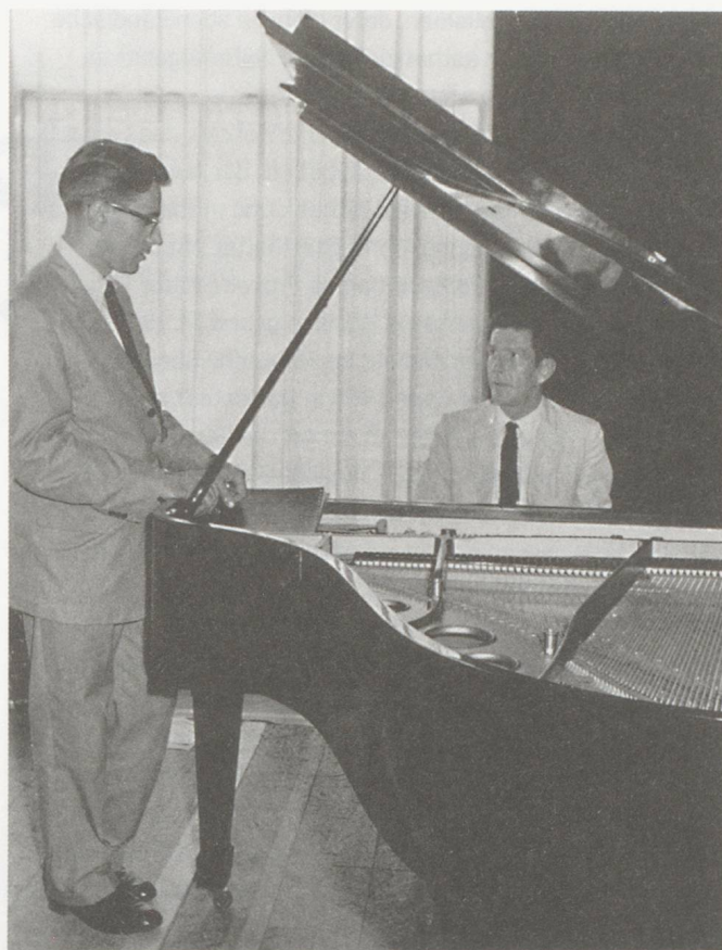
1958 an den Darmstädter Ferienkursen: David Tudor und John Cage (am Flügel).

Wie auch immer: Sein Auftritt hatte Folgen. Die Begriffe «Aleatorik» und «Indetermination» wurden zu gewichtigen