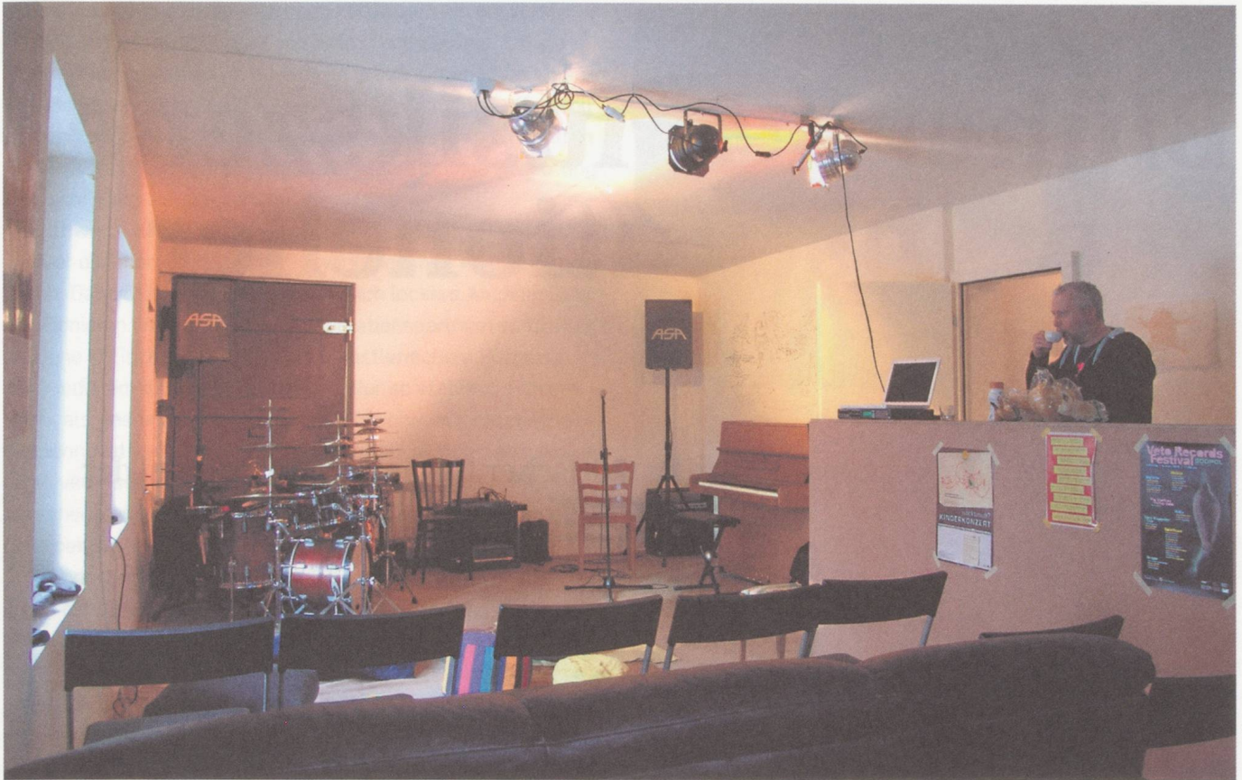
Am Stadtrand von Luzern: im Mullbau.

ist offen. Beim Joyful Noise Festival im ehemaligen Club étage zum Beispiel stehen jeweils über zwanzig Musiker unterschiedlicher Herkunft und Generation auf der Bühne und spielen in wechselnden Besetzungen miteinander. Es gibt keine Berüh- rungsgänge.» Und das Publikum zieht mit. Die Bieler Szene hat so eine wichtige Stellung in der Schweizer Impro-Szene erhalten; sie ist auch ein wenig ein Bindeglied zwischen Deutsch- und Westschweiz.