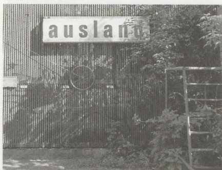
Eingang zum Klub ausland an der Lychener Strasse 60 in Berlin.