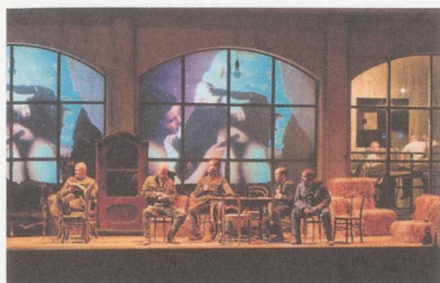
« Les Soldats » dans la mise en scène d'Alvis Hermanis.

« Les Soldats » de Bernd Alois Zimmermann au Festival de Salzbourg (Felsenreitschule, 19 août 2012)