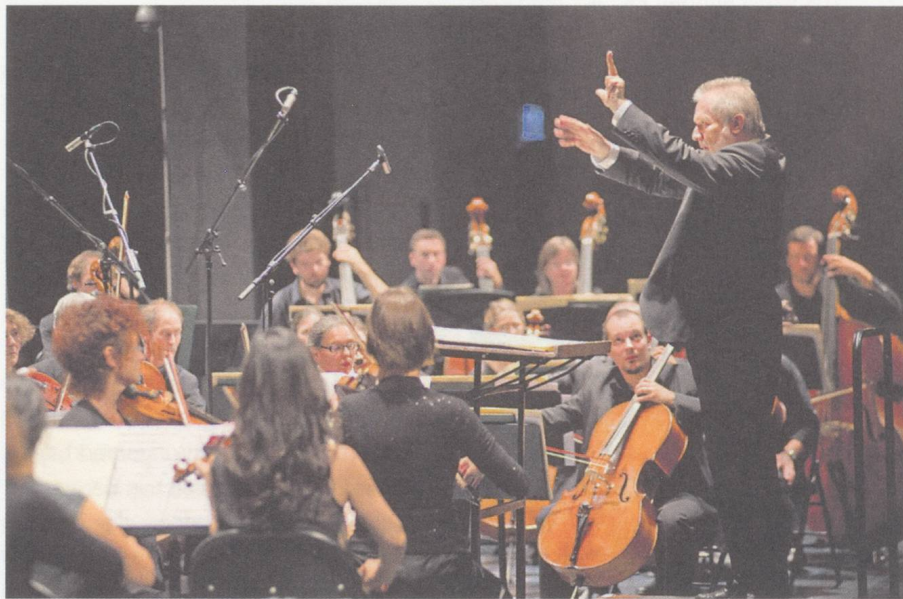
Péter Eötvös dirige la Basel Sinfonietta, 9 septembre 2012.