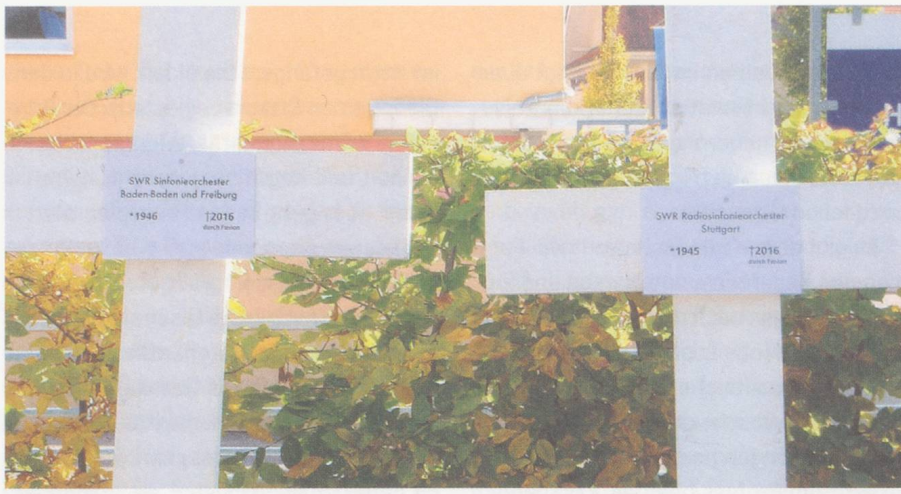
Kreuze markieren das Orchestersterben vor der Donauhalle in Donaueschingen.

Donaueschinger Musiktage (19. bis 21. Oktober 2012)