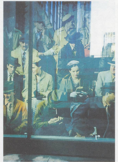
Vingt regards sur l'Enfant Jésus?

Das Festival Les Jardins Musicaux in Cernier, Arc et Senans und im Parc régional Chasseral (22. August bis 2. September 2012)