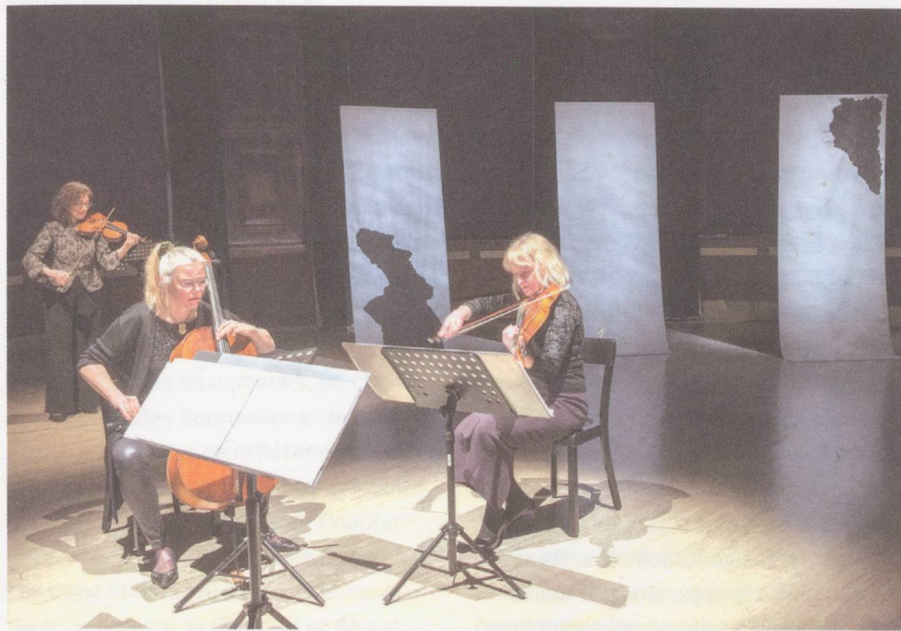
ensemble recherche.

«Anima Trianguli» – ein Musikprojekt zum Humanismus am Oberrhein in der Gare du Nord, Basel (16. Januar 2014)