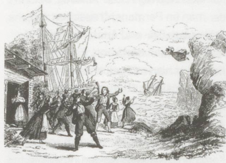
Historisches Szenenbild aus der Uraufführung von Wagners «Der fliegende Holländer».

Symposium zum Thema «Improvisieren – Interpretieren» des Forschungsschwerpunkts Interpretation der Hochschule der Künste Bern (12.–13. Oktober 2013)