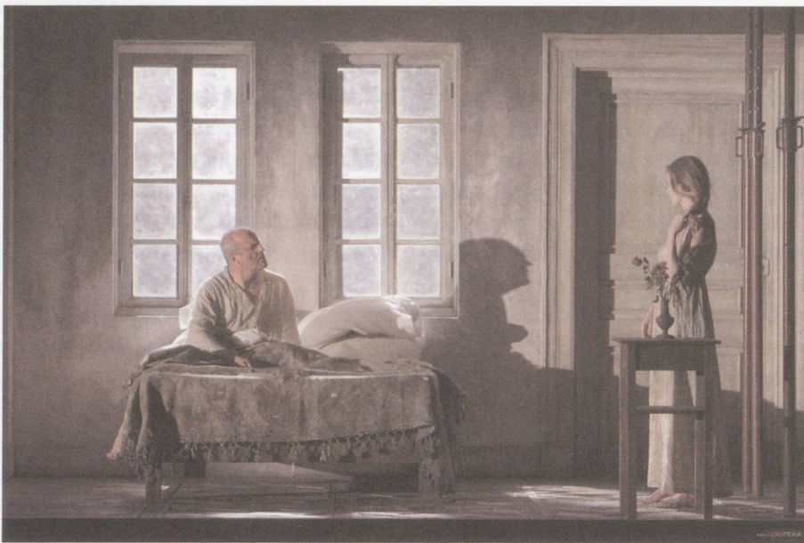
Barbara Hannigan (Agnes) et Christopher Purves (le Protecteur) dans « Written on Skin » de George Benjamin et Martin Crimp.

Le baromètre de cette édition 2013 du Festival d'Automne à Paris semble indiquer un temps plus hivernal que les saisons précédentes : la faute à une programmation réduite à la portion congrue par la place occupée par le théâtre et l'hybridation à parts égales du répertoire « savant » de la création contemporaine musicale avec le champ plus large des musiques « traditionnelles ». La perspective de départ ne permet pas de faire converger ces deux domaines, faute de réflexion poussée autour d'un rapport potentiel.