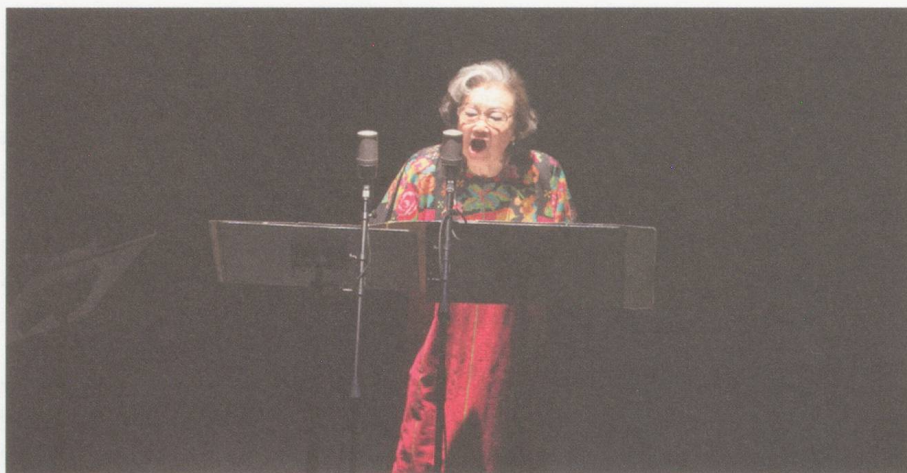
Michiko Hirayama.

Giacinto Scelsi-Festival in der Basler Gare du Nord (8.–10. Januar 2014)