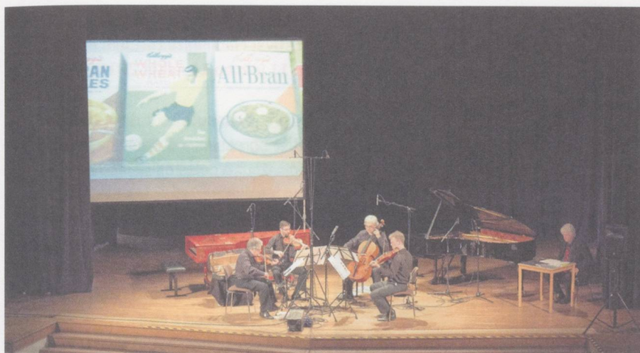
Beglückwünschte: Arditti Quartet.

in ihrer Beliebigkeit. Le temps, mode d'emploi für zwei Klaviere und Live-Elektronik (erstmalig gespielt vom Duo Grau/Schumacher) wiederum zeigte die Qualitäten des Computermusikers Manoury, der aus der Virtuosität spritzige Vielfalt und Energie gewinnt.