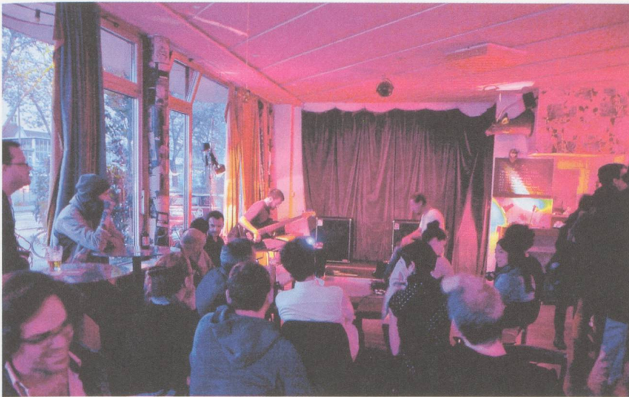
Locker am «KOMPAKT am Montag» im Bundeshaus zu Wiedikon.