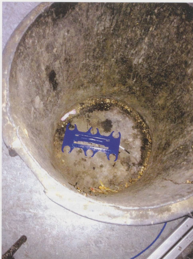
Blick in den Mülleimer während einer Lecture über Scelsi (Internationale Ferienkurse für Neue Musik 2014 in Darmstadt).

Wenn wir uns einmal vergegenwärtigen, in welchem inflationären Ausmass heute klassische Musik geboten wird, dann könnte einem ganz im Sinne der Kant'schen Formel (siehe oben, Kadenz III) übel werden. Vor dem Hintergrund dieser Erkenntnis müsste unsere Forderung eigentlich sein: nicht mehr Kultur, sondern weniger, nicht jede Woche irgendwo Beethoven, sondern – mal so als Vorschlag – nur noch alle zehn Jahre. «Noch nie in der Moderne gab es mehr Kunst, war die Kunst sichtbarer, präsenter und prägender in der Gesellschaft als heute», schreibt Christoph Menke in seinem philosophischen Plädoyer für «die Kraft der Kunst» 10 , und auch wenn man diese Diagnose gerne teilt, der Preis, oder besser: das Resultat dieser «ubiquitären Gegenwart» der Kunst ist eine Entvertikalisierung ihrer Produktions- und Rezeptionsumgebungen und eine zunehmende Verschiebung ihrer gesell-