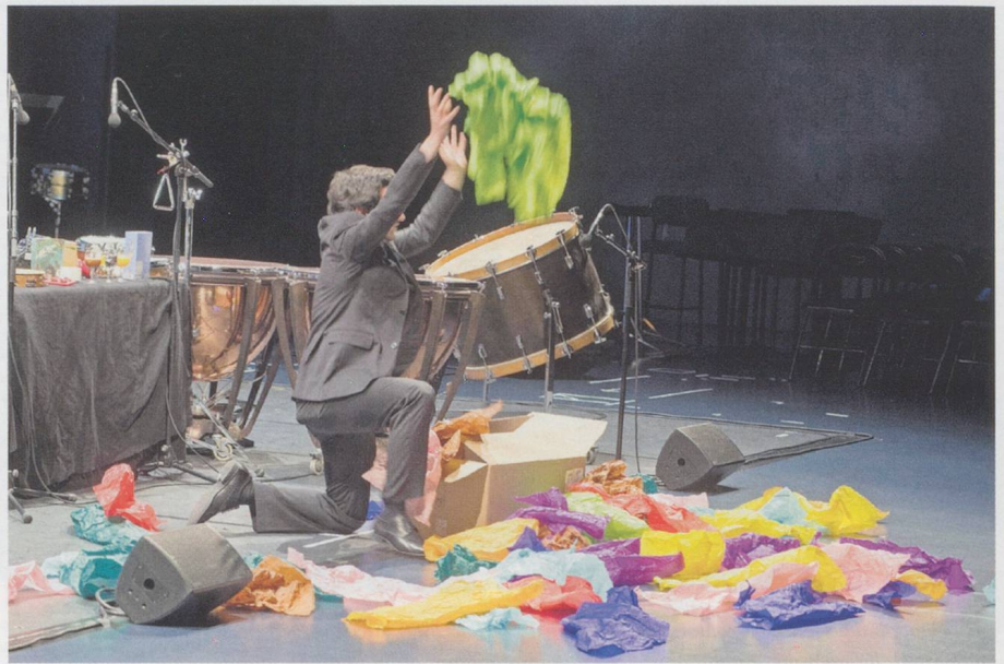
Der Schlagzeuger Thibault Lepri interpretiert «Allegro ma non troppo» von Unsuk Chin.

Der Ablauf eines Konzertes oder einer Oper folgt bestimmten Regeln: Auf der Bühne bieten Menschen etwas dar, was im Zuschauerraum von anderen Menschen mehr oder weniger aufmerksam verfolgt wird. Zunehmend gibt es in der zeitgenössischen Musik jedoch Konzepte, die dieses Prinzip durchbrechen: Besonders Kunstschaffende an der Schnittstelle zwischen Klang und visueller Kunst, zwischen installativer Performance und elektronischer Komposition suchen nach neuen Wegen der Darstellung.