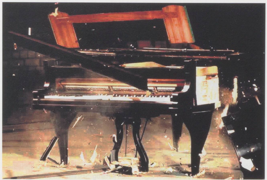
«Piano Concerto» von Simon Steen-Andersen.

«Ich bin doch nicht für zehn Lacher nach Donaueschingen gekommen», sagt der eine, und der andere am Stammtisch fügt hinzu: «Witzig ist keine ästhetische Kategorie!» Oh doch, auf jeden Fall, möchte man dazwischen rufen. Die Frage ist nur, ob die Musik das tragen kann. Und das kann sie zuweilen durchaus.