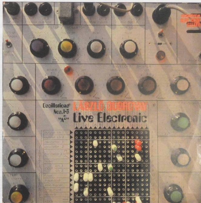
Figure 1 : Le premier disque d'électronique en temps réel en Hongrie – œuvres de László Dubrovay (Hugaroton, 1979).

Ce n'est ni pendant sa jeunesse, ni sous l'influence de Kodály, Bartók ou d'un de leurs héritiers, que Dubrovay s'est tourné vers la musique folklorique, mais bien plus tard, suite à l'apprentissage approfondi des techniques de composition les plus modernes (y compris celles fondées sur l'utilisation de l'ordinateur), à une époque de pleine maturité stylistique. Pendant ses années d'études à l'Académie Franz Liszt de Budapest, il a travaillé au sein de l'Ensemble Vasas : comme accompagnateur de danseurs, il devait jouer des arrangements de pièces folkloriques au piano. On l'a sollicité pour composer des œuvres nouvelles, mais il s'y est toujours refusé, estimant ne pouvoir dépasser l'œuvre de Bartók et de Kodály dans ce domaine. Conséquent avec lui-même, il s'est longtemps interdit de toucher aux mélodies issues de la musique folklorique.