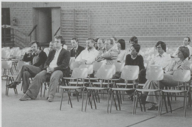
Ein Vortragspublikum in der Darmstädter Böllentorhalle.

Die Hochkonjunktur erfuhr einen Einbruch: Rezession, Ölkrise, autofreie Sonntage – und die Erkenntnis, dass die Ressourcen irgendwann zu Ende gehen würden. Von da an war nichts mehr selbstverständlich, am wenigsten der Fortschritt. Dies hatte auch Auswirkungen auf die Musik, die das Bleierne der Zeit, die resignative und sich mit allem arrangierende Grundhaltung in wichtigen Werken verarbeitete. Bezeichnenderweise trat gerade jetzt eine Gestalt wie Friedrich Hölderlin (1770–1843) in den Vordergrund, der 1807 als unheilbar krank zum Rückzug