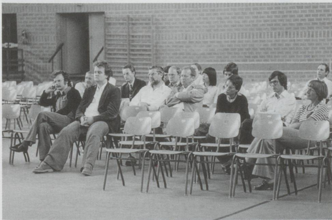
Ein Vortragspublikum in der Darmstädter Böllentorhalle.

Die Hochkonjunktur erfuhr einen Einbruch: Rezession, Ölkrise, autofreie Sonntage – und die Erkenntnis, dass die Ressourcen irgendwann zu Ende gehen würden. Von da an war nichts mehr selbstverständlich, am wenigsten der Fortschritt. Dies hatte auch Auswirkungen auf die Musik, die das Bleierne der Zeit, die resignative und sich mit allem arrangierende Grundhaltung in wichtigen Werken verarbeitete. Bezeichnenderweise trat gerade jetzt eine Gestalt wie Friedrich Hölderlin (1770–1843) in den Vordergrund, der 1807 als unheilbar krank zum Rückzug