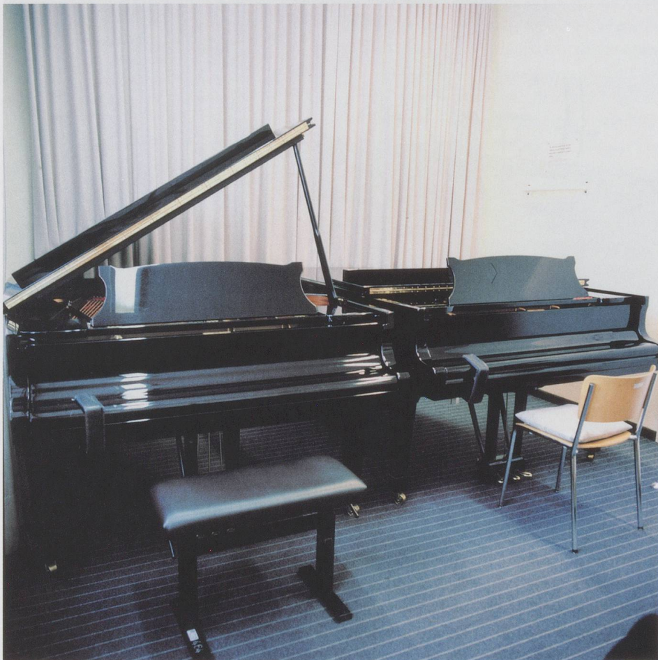
Oben: Jazzcampus Basel, Utengasse 15; unten: Hochschule für Musik Basel, Leonardsstrasse 6.