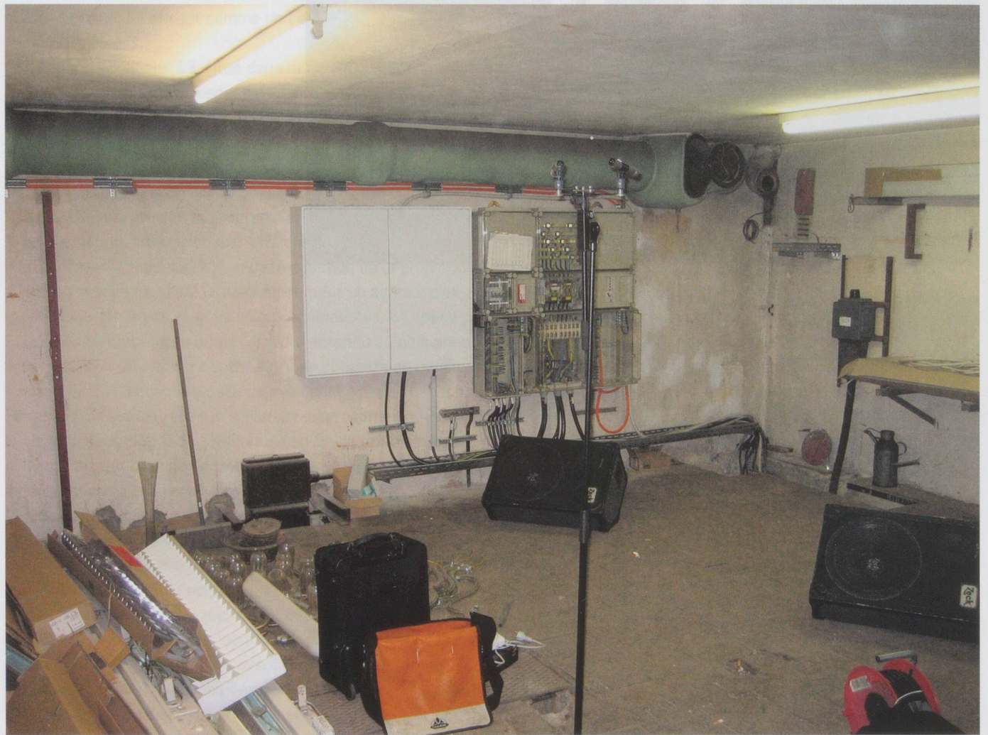
«Friedrich-Engels-Straße 27, 34117 Kassel. Erbaut 1941. Kellerraum eines Hochbunkers. 18 qm. Neonbeleuchtung. Reste alter Lüftungsanlagen.» (Aus Martin Schüttlers Radiostück «Leerstand», 2009)

In wechselnder Höhe hangelt sich eine Sinuswelle am Stahlbeton entlang, auf der Suche nach einer Antwort. Ihr steter Begleiter: ein leises Brummen im Hintergrund. Unklar ist, ob das auf die Neonröhren oder ebenfalls auf die Lautsprecher zurückgeht, die das leere Gebäude aus Kriegstagen beschallen.