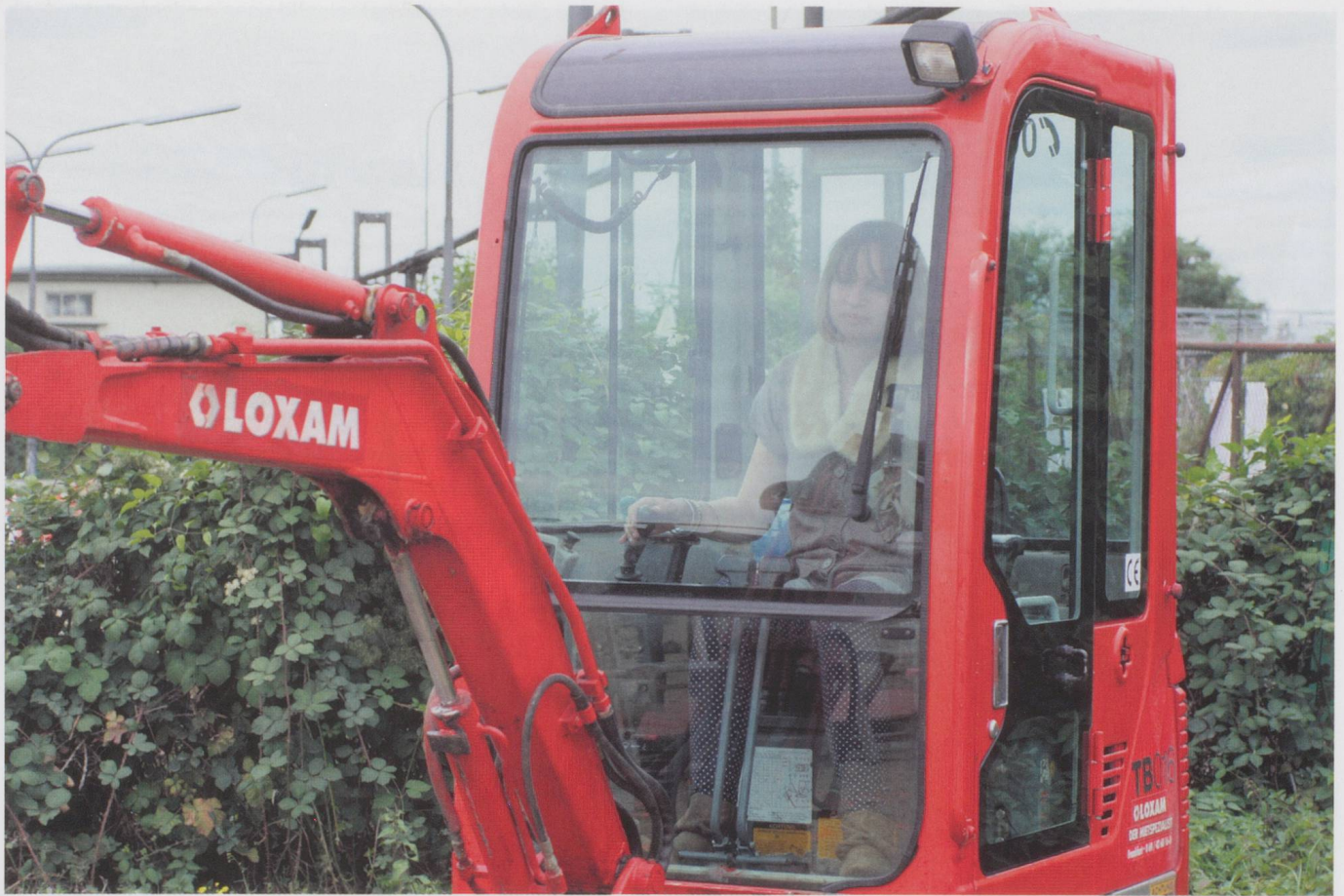
Lea Letzels «Performance für Mädchen und Minibagger» in Offenbach am Main.