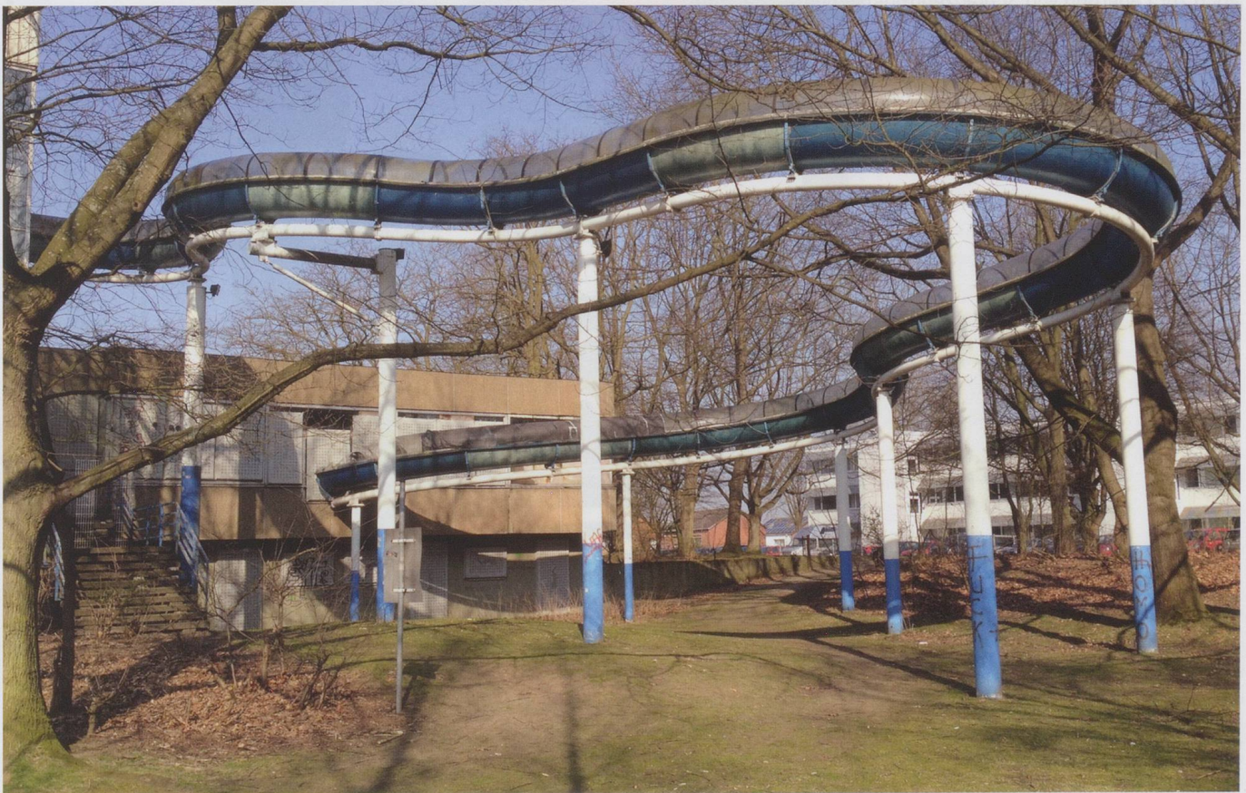
Die Aussenrutsche in Marl aus Denise Ritters Installation «off-time».

Geschäftsführer Mennicken und sein Team von ON kümmern sich in Köln um neue Orte für Akteure der Neuen und frei improvisierten Musik. «Das Leerstandsthema ist in Köln extrem virulent», weiss er aus Erfahrung. Industriebauten und zahllose Ladenlokale (auch das Büro, das ON bis vor kurzem genutzt