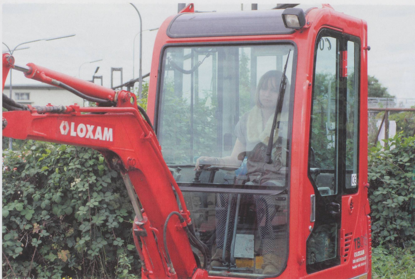
Lea Letzels «Performance für Mädchen und Minibagger» in Offenbach am Main.