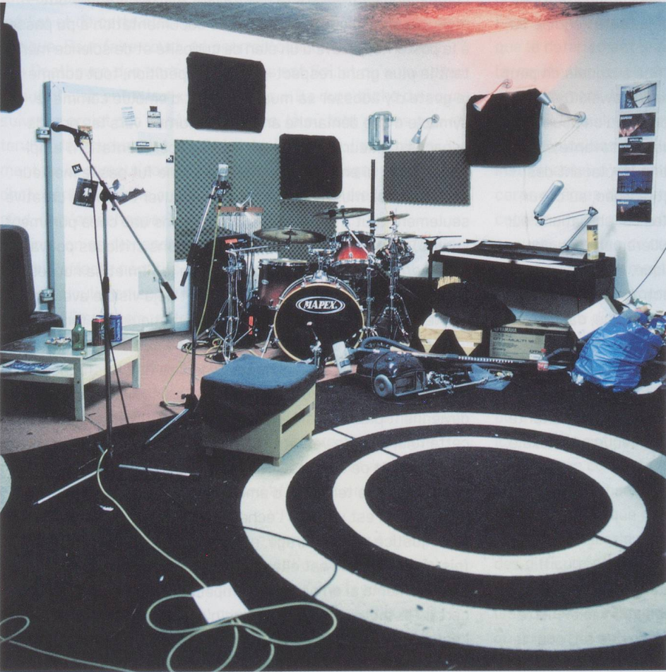
Oben: Filter 4, Reservoirstrasse, Basel; unten: Proberaum der Bands PAKS, pQadrat und RapBau, Efringerstrasse 32, Basel.