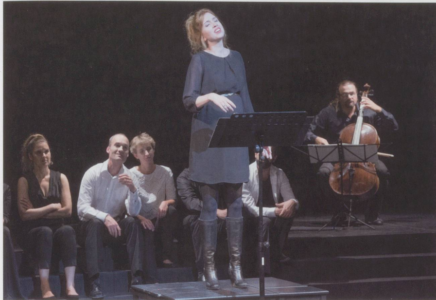
«WytenbachMaterial» am Lucerne Festival.

Lucerne Festival im Sommer 2015 – «composer-in-residence» Jürg Wytenbach (21. und 22. August 2015)