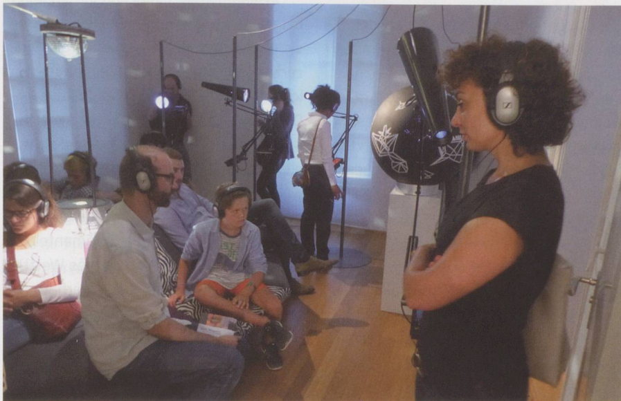
Hör-Fernrohre in der Ausstellung «Seismographic Sounds» in Aarau.

Seismographic Sounds – Visionen einer neuen Welt. Wanderausstellung im Forum Schlossplatz Aarau (15. August bis 20. September 2015)