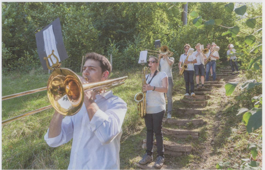
Ein Kanon für unterwegs.