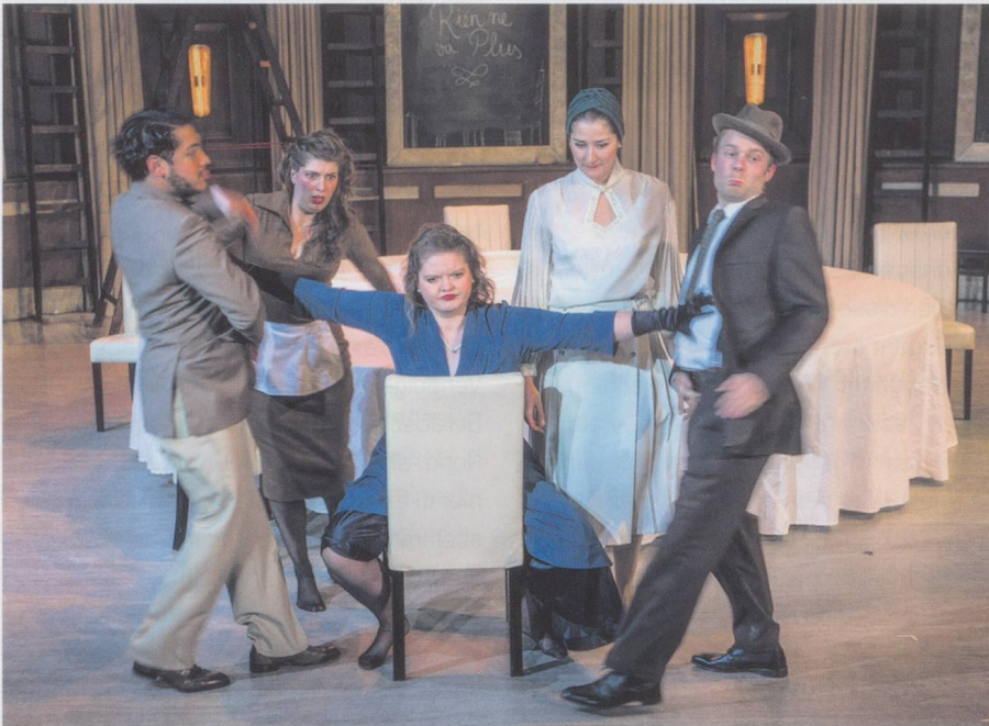
Wer spielt mit wem? «Mad Couples» in der Gare du Nord.

Ernst Kreneks Kammeroper «Vertrauenssache» mit Arien-Interventionen aus Mozarts «Cosi fan tutte» zur Saisoneroöffnung der Basler Gare du Nord (Premiere am 20. Oktober 2015)