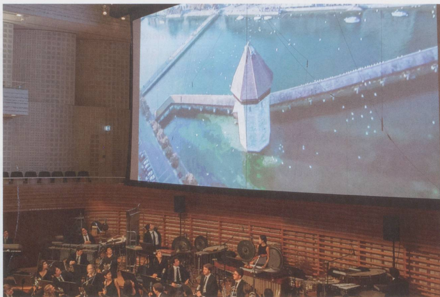
Eine Sinfonie für Luzern.

nen, bildete einen der Höhepunkte des Konzerts: Sieber persönlich setzte sich urplötzlich an die KKL-Orgel und legte donnernd los. Weitere Überraschungen: eine laute Guggenmusik, die in den Saal platzte und das Orchester übertrumpfte, und ein Kinderchor, der «Lozärn hani gärn» sang. Trotz all dieser Events im Laufe der Sinfonie für Luzern hat das Werk Längen, weil die Tonsprache für sich alleine nicht überraschend ist, weitgehend tonal, halb jazzig, halb klassisch-avantgardistisch. Das Innovative dieses Projektes ist schlussendlich nicht die Musik, sondern der Weg dorthin, die Begeisterung, der Musikvirus, der sich im Laufe des letzten Jahres an verschiedensten Orten und Institutionen in Luzern ausgebreitet hat. Dank Machover und seinem didaktischen Geschick. Dank innovativen technischen Hilfsmitteln.