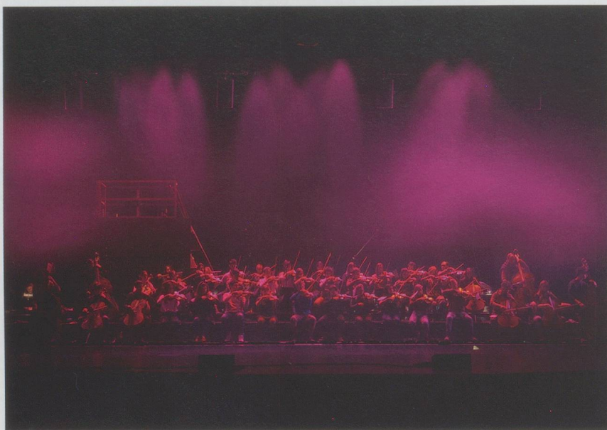
Lever du soleil au pôle nord : «Trans» de Stockhausen.

Deux concerts du festival Archipel (Genève, 10 au 20 mars 2016)