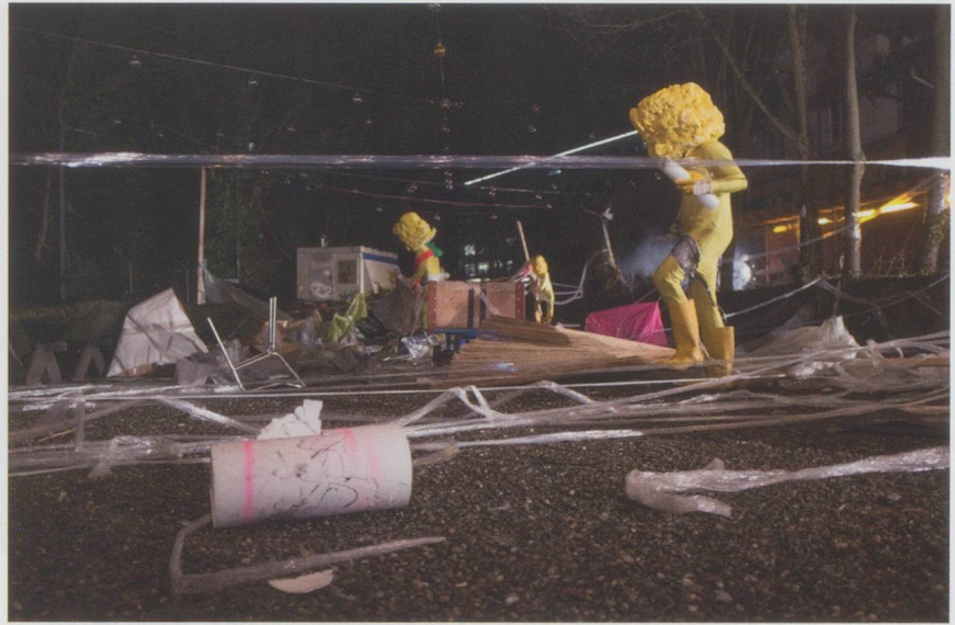
Skurriler Pausenauftritt in der Gessnerallee.

Patrick Franks «Freiheit – die eutopische Gesellschaft» im Theaterhaus Gessnerallee Zürich (13. Februar 2016)