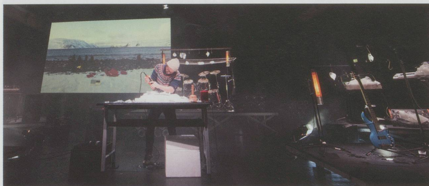
Das Eis schmilzt in «LIEBE» von Seidl/Kötter am Festival Maerzmusik Berlin.

«LIEBE – Ökonomien des Handelns 3» von Hannes Seidl und Daniel Kötter (Festival Maerzmusik Berlin, Sophiensaele, Uraufführung am 16. März 2016)