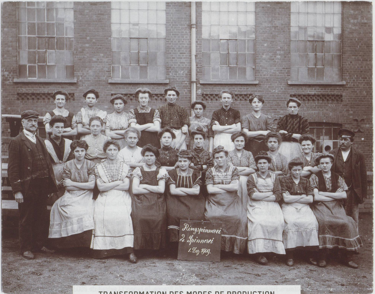
TRANSFORMATION DES MODES DE PRODUCTION La filature de coton à Leipzig 1909 / 2009.