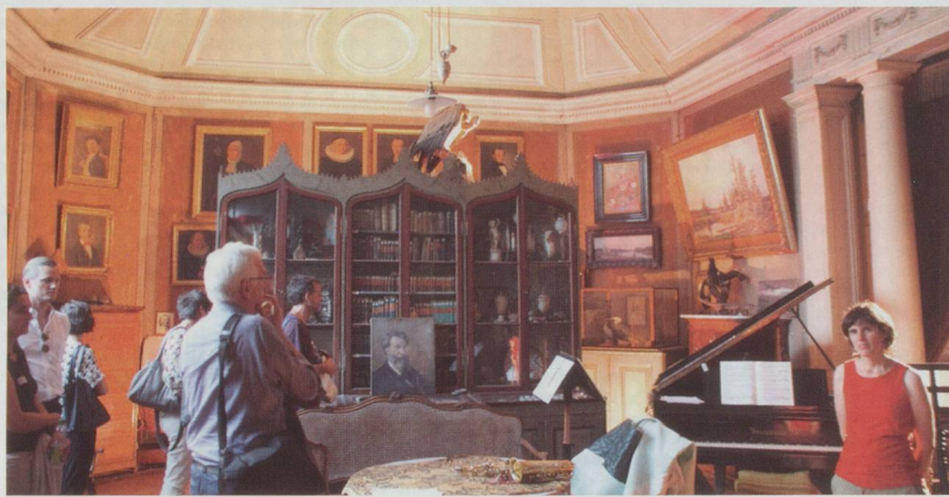
Das Atelier von Vater Schoeck in der Villa Ruhheim in Brunnen, in dem Othmar auch manchmal komponiert hat.

Symposium «Als Schweizer bin ich neutral – Schoecks Oper Das Schloss Dürande und ihr Umfeld» (9. bis 11. September 2016 im Schoeck-Hotel Eden in Brunnen). Eine Veranstaltung der Hochschule der Künste Bern in Zusammenarbeit mit dem Othmar Schoeck Festival, Brunnen.