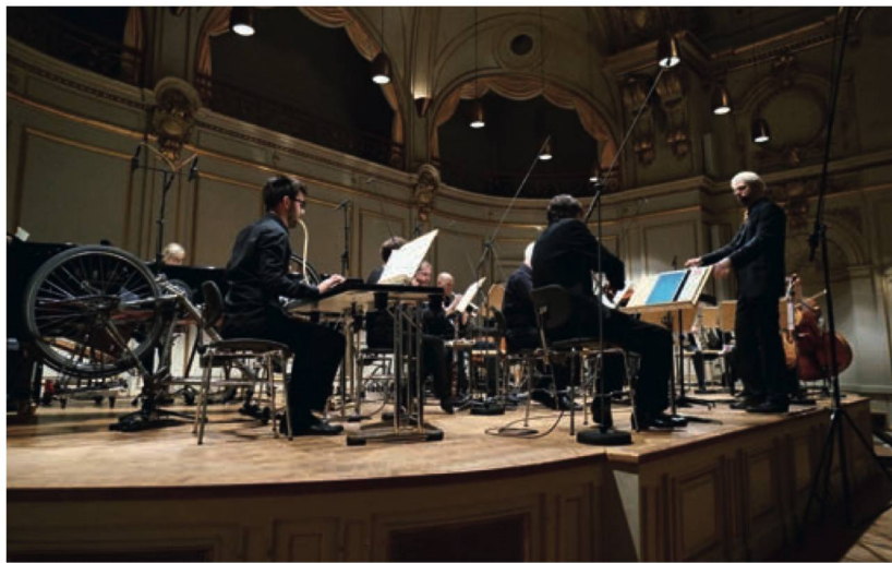
Das Collegium Novum Zürich tritt in die Pedale.