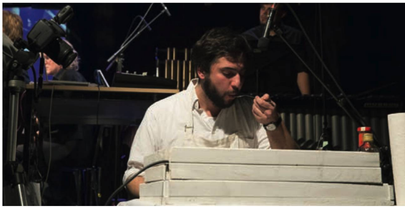
Guten Appetit! Schnitzel mit Ketchup – das Ensemble Studio Dan.

30 Jahre Tage für Neue Musik Zürich (16.–20. November 2016)