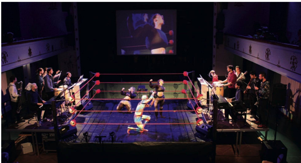
Im Ring: Proton, Vertigo und die kämpfenden Tänzerinnen.