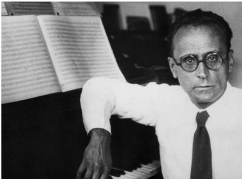
Anton Webern 1930 in seinem Arbeitszimmer in Mödling

Robert Schumann Gesamtausgabe , zu Worte kommen: «Der Werktext ist in den letzten Jahrzehnten ... immer instabiler geworden ... die Editorik hat darauf angemessen reagiert, doch ... das Zeitalter der Gesamtausgaben ist im Niedergang. Auf Papier gedruckte Gesamtausgaben, wie sie im 19. Jahrhundert begründet worden sind, wird es auf lange Sicht nicht mehr weiter geben.» 2 Eine Konsequenz haben die Herausgeber der AWG bereits gezogen: Texte und Paratexte werden hybrid veröffentlicht, das heisst nur zum Teil auf Papier und ergänzend im Internet, im «open access». Auch weiss das Editorenteam, dass die Zeit der «Denkmäler-Editionen» vorüber ist und ein Text unbedingt eines Kontextes bedarf, um verstanden und gewürdigt zu werden. Das ist im Falle des Komponisten Webern besonders sinnvoll: Wir erinnern uns der wechselvollen Rezeptionsgeschichte seines Werkes, dessen Opera 1 bis 31 in ihrer Dichte und Kürze in den 1950er und 1960er Jahren Komponisten, Wissenschaftlern und praktischen Inter-