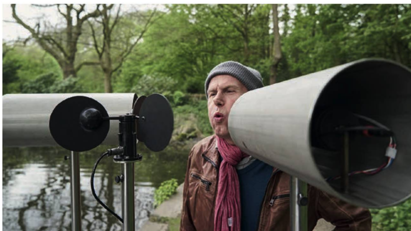
Wittener Tage für neue Kammermusik 2017. Cathy van Ecks Installation Erster Versuch den Wind zu drehen am Hammerteich Witten.

Wittener Tage für neue Kammermusik (5. bis 7. Mai 2017)