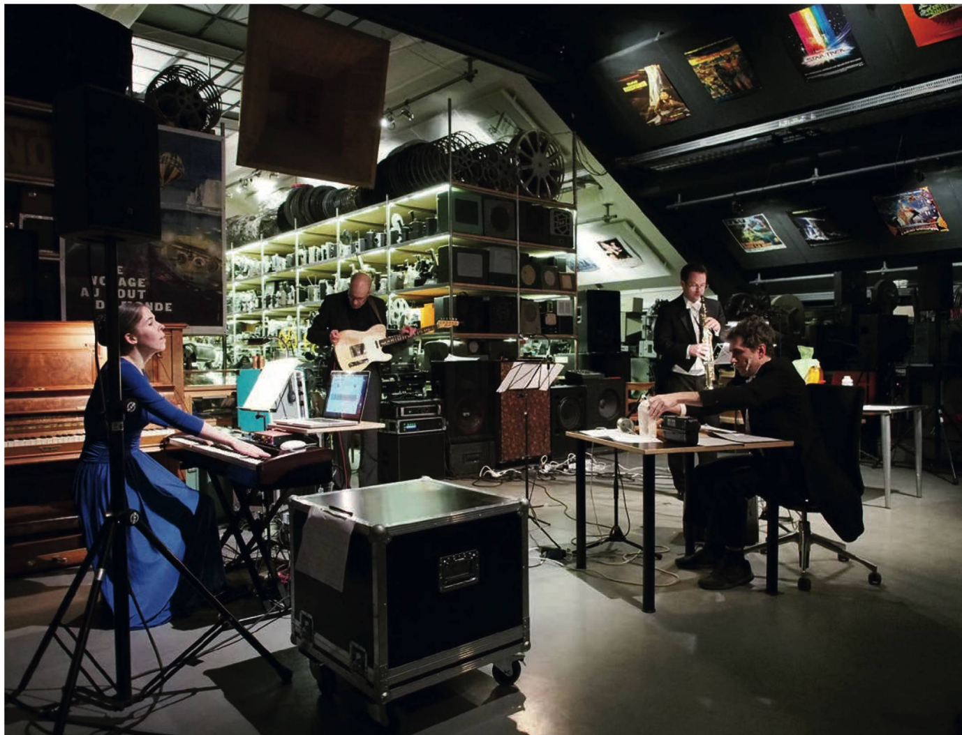
Das Ensemble Tzara bei der Uraufführung von Wanja Aloes Komposition Alles wird gut im Lichtspiel Bern .

Die Saison 2016/17 des Ensemble Tzara, Zürich