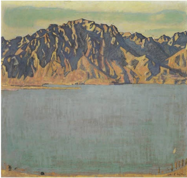
Ferdinand Hodler: Der Grammont (1906).

Art der New Complexity. Und nun Esquisse : « le froid », dieses Concertino für Marimbaphon solo und vierzehn Instrumente. Wie bereits früher hat Feldmann einen Text der französischen Dichterin Anne-Marie Albiach vermessen, also die Länge der Wörter und die Abstände dazwischen sowohl beim Lesen zeitlich als auch auf dem Blatt graphisch. Und ich glaube ihm gern, dass diese Lektüre wiederum den «genetischen Code» der Zeitstrukturen in der Solopartie bildet sowie die Grundlage für die wechselnden Rhythmus-Flächen des Begleitensembles. Bloss hat er hier sein Verfahren auf ein anderes Klangmaterial angewendet. Denn wer hätte von Feldmann je ein Stück erwartet, in dessen drittem Takt ein Dominantseptnonenakkord über C auftaucht!? Hier begegnen wir einem gradlinigen, klar fasslichen, ja schönen und sinnlichen Stück, diesseits allen Vermessens.