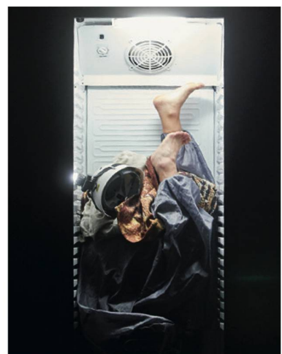
Klaustrophobische Klangskulptur im Kühlschrank: Sous Vide von Dmitri Kourliandski.