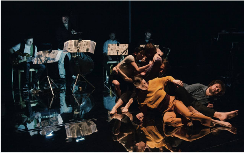
Enge Körperballung beim Hohen Lied der Liebe in Dominique Girods Orpheus .

(Uraufführung am 6. März 2018 im Fabriktheater, Rote Fabrik Zürich)