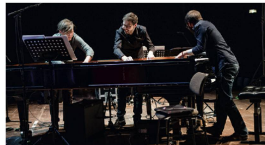
Feinarbeit im Innenklavier: Das Ensemble Nickel im Radialsystem.

In manchen Konzerten zeichnete sich nämlich eine ästhetische Polarität ab, an der man ansetzen könnte, um die jüngsten Entwicklungen der Musik in den Blick zu kriegen. Die beiden Pole erinnern an den alten Gegensatz von Impressionismus und Neusachlichkeit, von Naturalismus und Mechanik. Yair Klartag, Artist in Residence des Festivals, vertritt in dieser Zuspitzung jene Tendenz zum Naturhaften, die sich auf die alte Formel bringen lässt: Die Natur macht keine