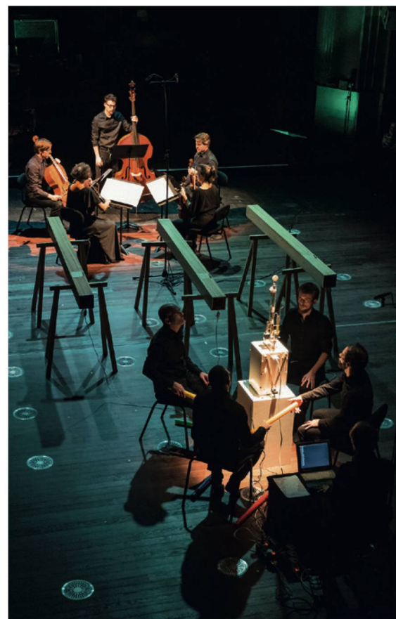
Rites imaginaires : les ensembles NKM et Eklekto dans Hitonokiesari de Masahiro Miwa.