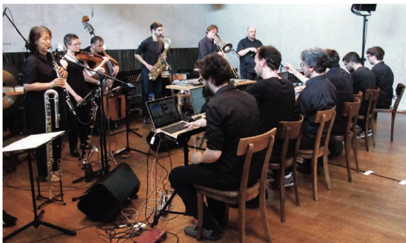
Das Ensemble Phoenix Basel mit schwebenden Sinustönen in der Uraufführung von Lukas Huber.

Blanko 2018 – Konzert mit dem Ensemble Phoenix Basel und Uraufführungen von und mit Maja Solveig Kjelstrup Ratkje und Lukas Huber (Restaurant schmatz, Münchenstein/Basel, 11. Juni 2018)