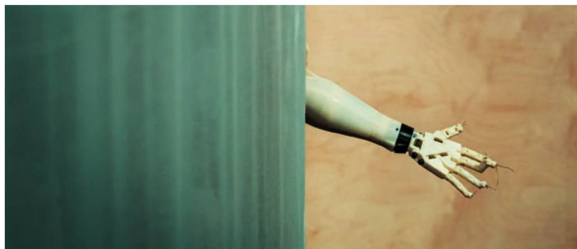
L'inhumain du programmeur : Thinking Things de Georges Aperghis