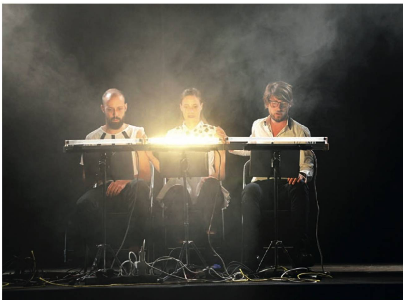
Prisonniers en transe. L'ensemble WeSpoke actionne les rotors dans H de Simon Løffler

Deux soirées du festival Usinesonore à la Neuveville (26 mai au 2 juin 2018)