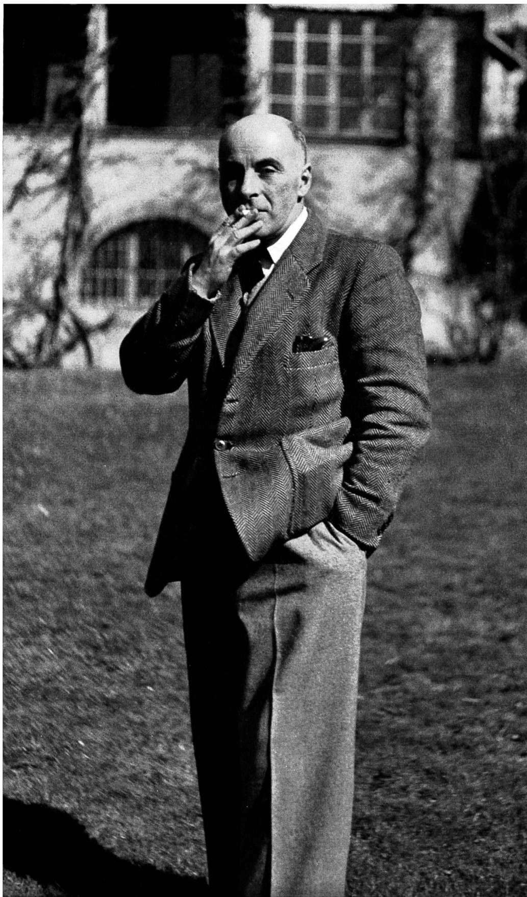
Francis Ponge, 1949.