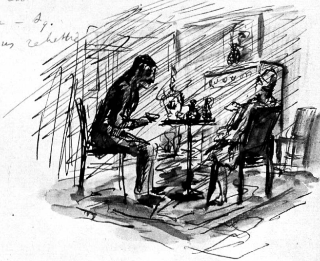
Paul Valéry : Stendhal (manuscrit autographe, illustré de dessins à la plume aquarellés).

Mais la question est insoluble. nous ne saurons jamais exactement reposer ce qui faudrait pour opérer le confortement de l'âme avec l'intention - les côtés intimes qui font l'ouvrage - &c. nous devons donc us rebetter