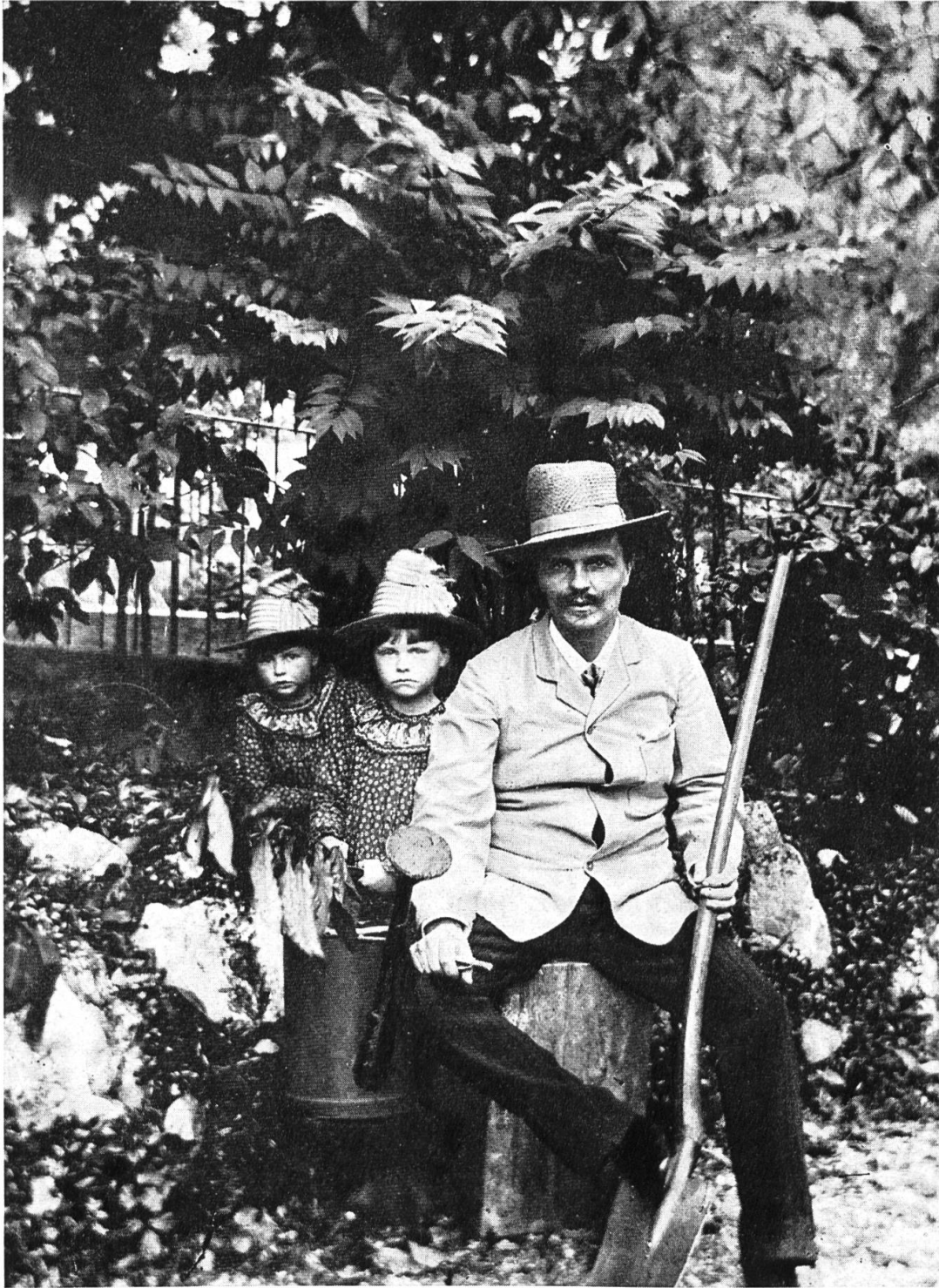
Strindberg et ses filles Photo prise par lui-même dans le jardin de l'hôtel Gersauerhof, Gersau 1886