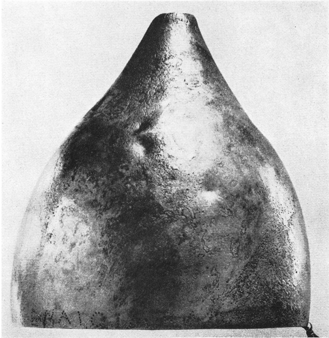
Fig. 3. — Casque oriental trouvé à Olympie en 1960. Offrande athénienne provenant du butin des Guerres médiques et portant cette dédicace : Διὶ Ἀθηναῖοι Μεδὸν λαβόντες.