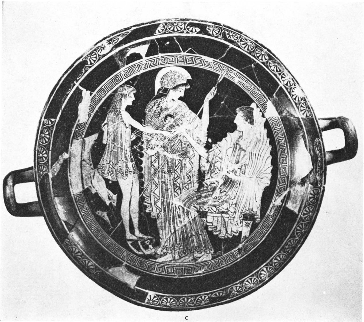
Fig. 2. — Borée ravissant Oreithyia. Péliké du Peintre des Niobides. Würzburg 511.