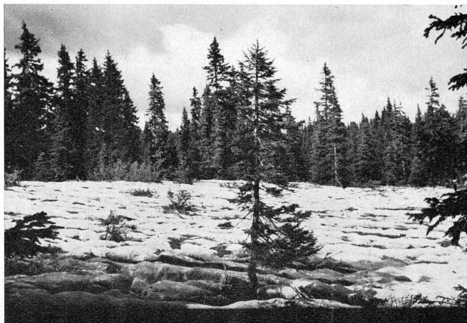
Pl. 3. — Les lapiés de la Joratte, W du Marchairuz.