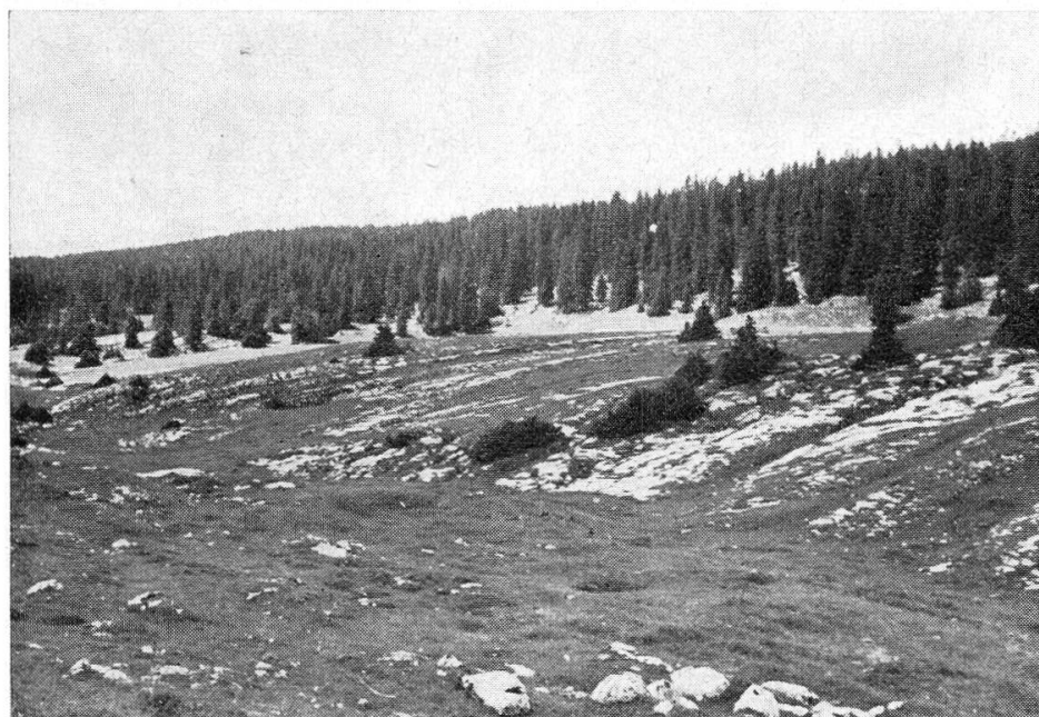
Pl. 2. — La Sèche des Amburnex.