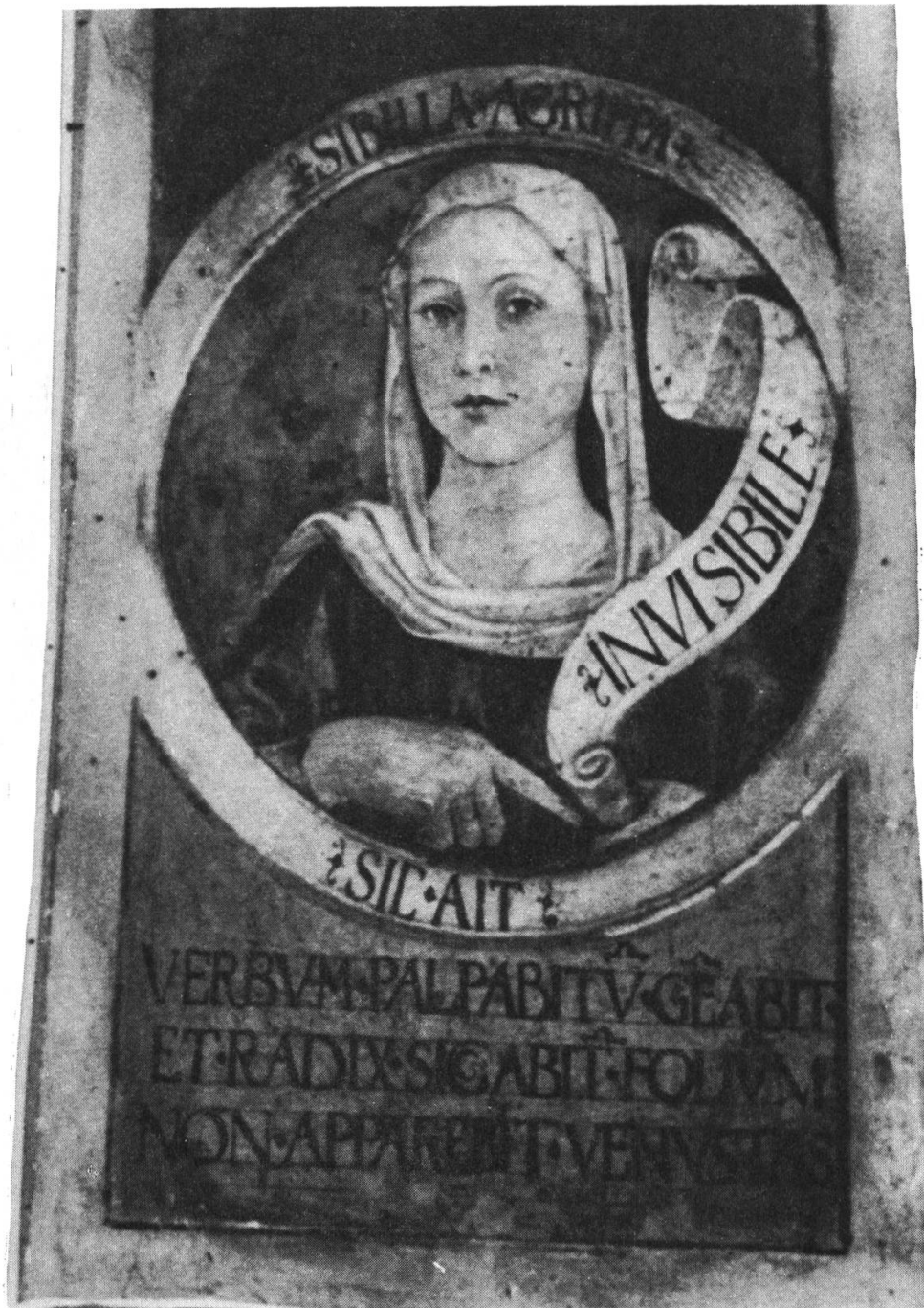
Fig. 2 — Sibilla Agrippa, détail d'une série de Sibylles. Tivoli, église Saint-Jean l'Evangeliste (attribuée à Antoniazzo Romano?).