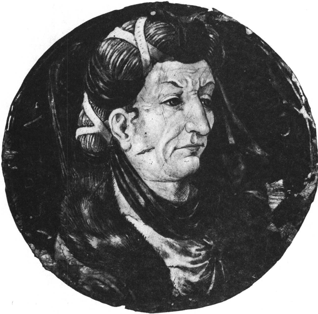
Fig. 1 — Sibilla Agrippa, émail sur cuivre. Turin, Musée civique.