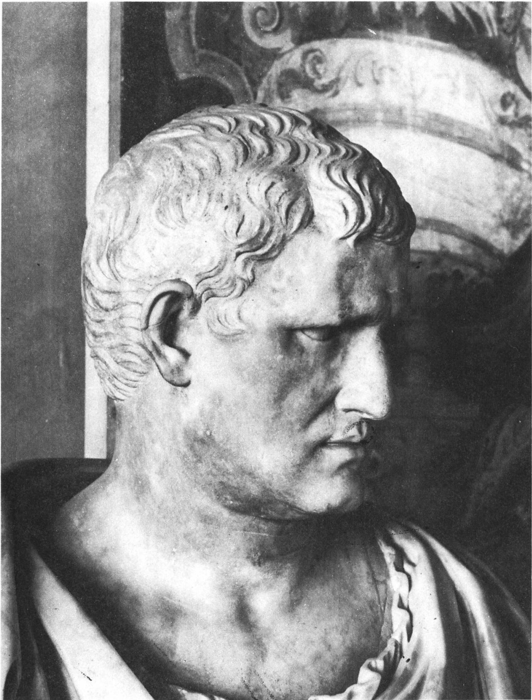
Fig. 4 — Portrait de M. Vipsanius Agrippa. Florence, Musée des Offices.