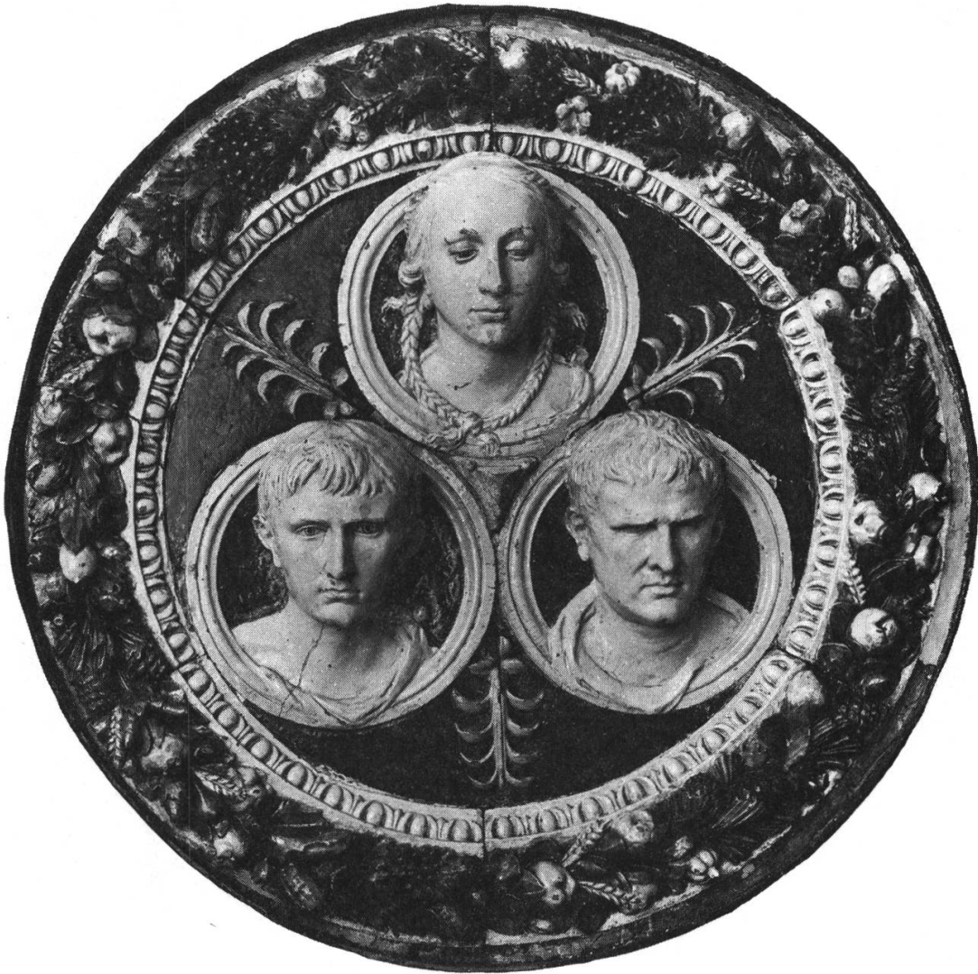
Fig. 5 — Auguste, Agrippa et peut-être Livie, dans un médaillon attribué à Giovanni Della Robbia, en provenance du Palazzo Guadagni à Florence. Londres, Victoria and Albert Museum.