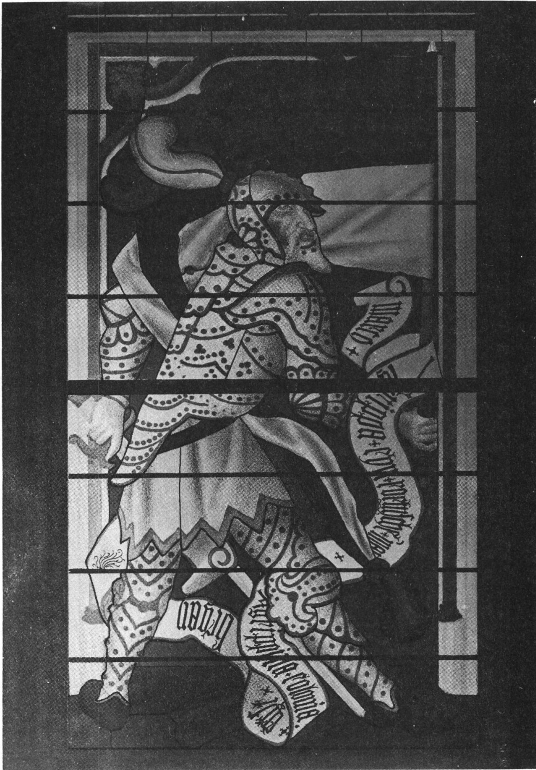
Fig. 7 — M. Vipsanius Agrippa. Cologne, cathédrale.