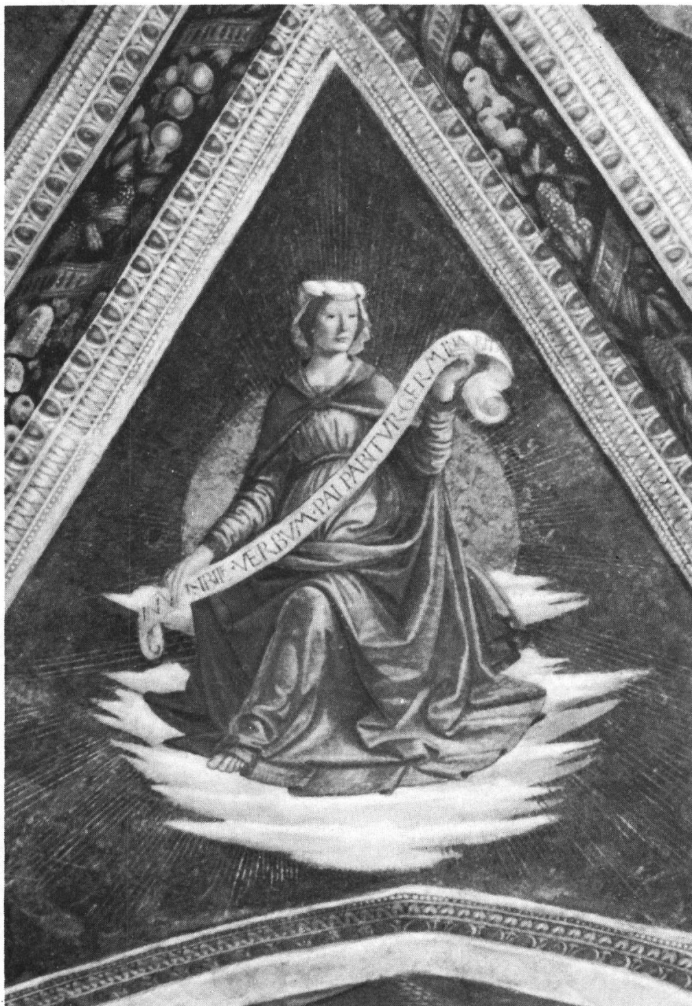
Fig. 3 — Sibilla Agrippa , de la voûte de la chapelle Sassetti (D. Ghirlandaio). Florence, église de la Sainte-Trinité.