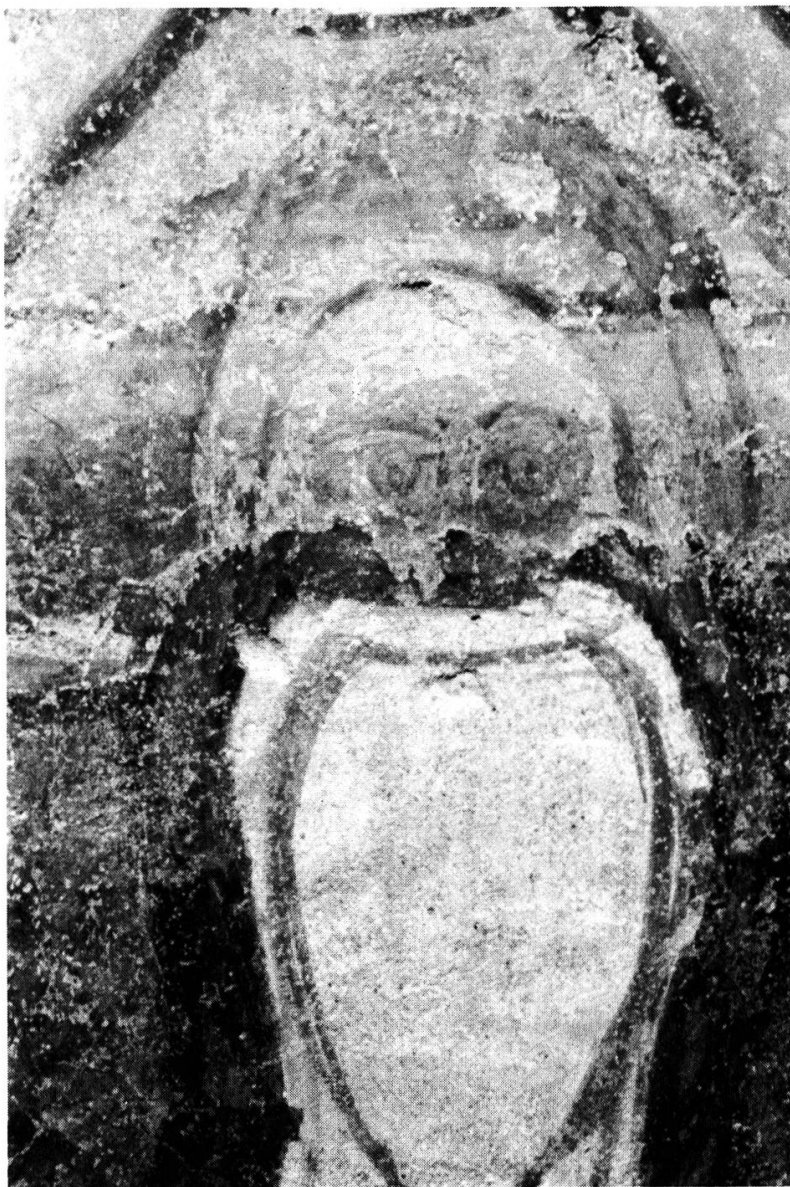
Fig. 4. — TORBA: tour, 2 e étage, mur ouest; les nonnes (avec repentir de l'artiste).