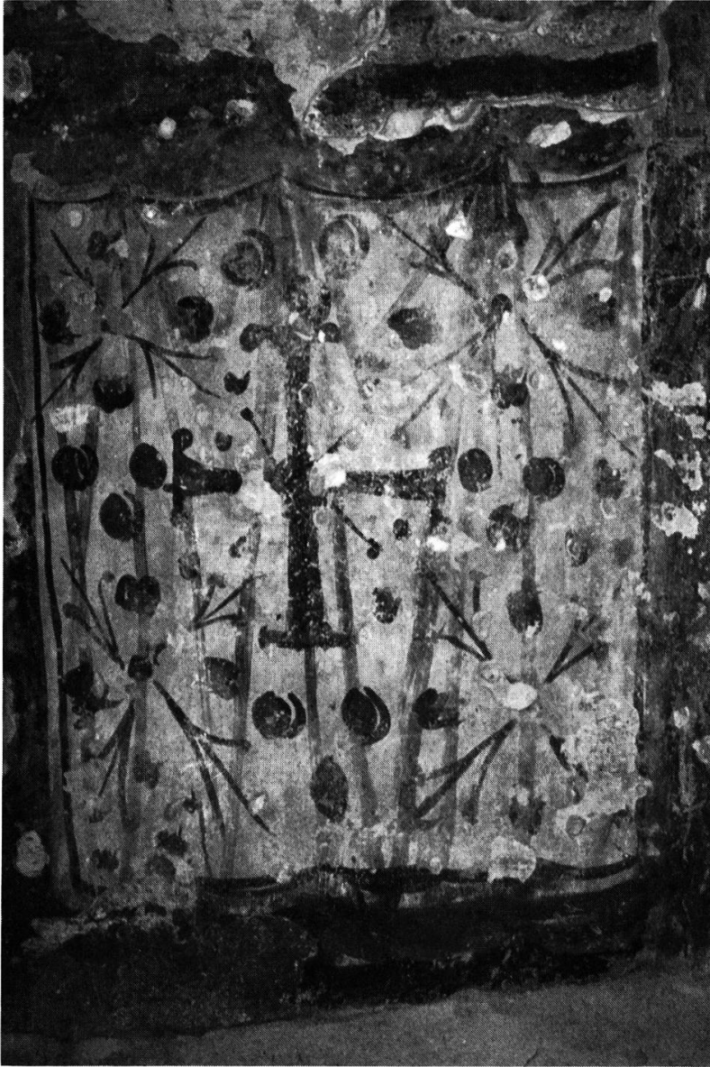
Fig. 7. — TORBA: tour, 2 e étage, mur est (registre inférieur) partie du velum .