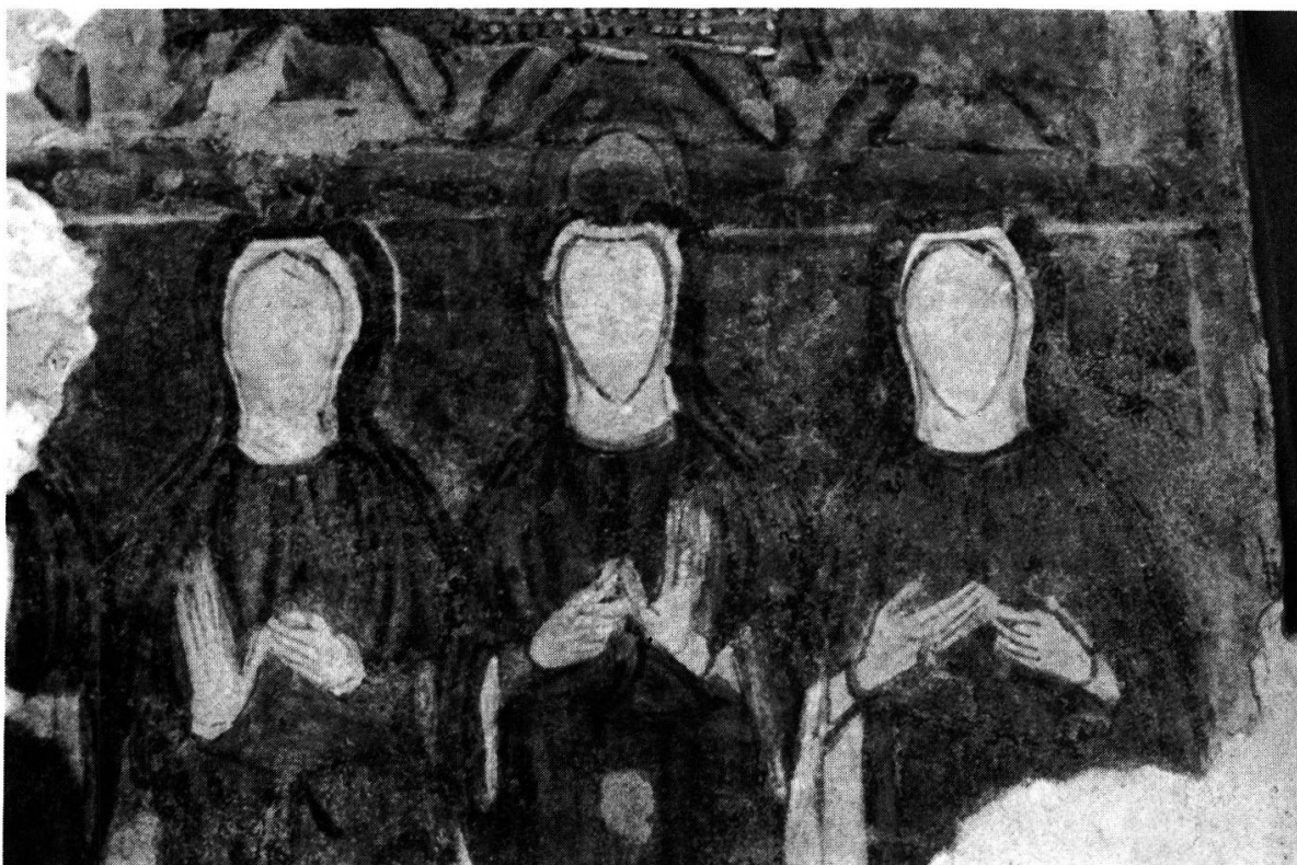
Fig. 5. — TORBA: idem; les nonnes .