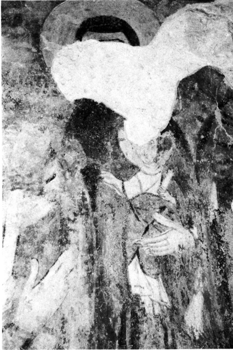
Fig. 3. — TORBA: idem, après la restauration et la disparition de la tête.