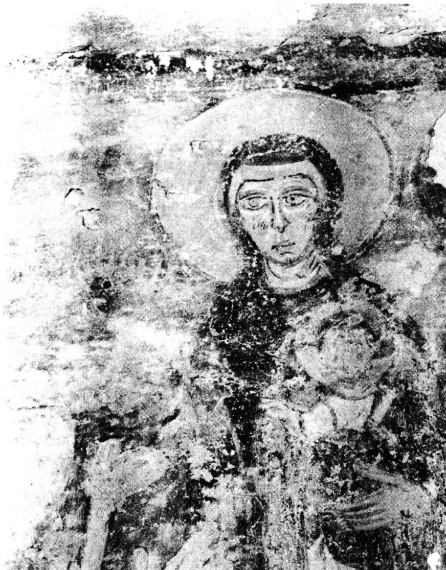
Fig. 2. — TORBA: tour, 2 e étage, mur sud; Vierge à l'Enfant avant la restauration et avant la disparition de la tête.