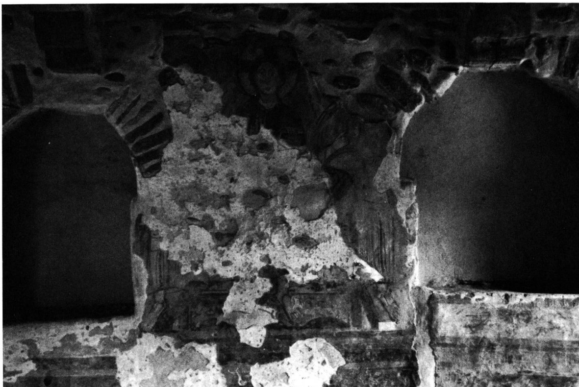
Fig. 6. — TORBA: tour, 2 e étage, mur est: Christ au trône (avec deux anges); à droite sous la fenêtre deux canards (de part et d'autre d'une hydrie).