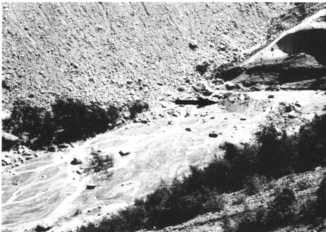
Fig. 1. — Le front du glacier des Bossons en août 1980.

devient peu à peu générale et qui n'est interrompue que par quelques petites poussées secondaires. A partir de 1955, le nombre des glaciers en retrait diminue. Beaucoup d'appareils deviennent stationnaires et certains sont en crue 7 . Entre 1975 et 1985 se produit une crue relativement importante. Certains glaciers du massif, qui réagissent particulièrement rapidement aux modifications de climat, épaississent et avancent fortement de 1978 à 1982. C'est le cas des glaciers des Bossons et d'Argentière. La zone frontale de ce dernier a tellement épaissi que, dès 1980, il a fallu creuser en permanence une tranchée dans la glace pour le passage de la benne du téléphérique d'EDF. Par la suite, un pylône du même téléphérique, situé au bord du glacier en rive gauche, a dû être déplacé. Les figures 1 et 2 montrent le maximum d'extension atteint par le glacier des Bossons en 1982 et illustrent la mobilité de ce front glaciaire. En août 1980 (fig. 1), l'extrémité de la langue glaciaire, étroite, touche presque une petite moraine frontale (flèche horizontale). Elle se situe à une vingtaine de mètres du bosquet qui borde le sandur en rive droite. En août 1982 (fig. 2), le glacier a atteint le bosquet et quelques arbustes ont été recou-