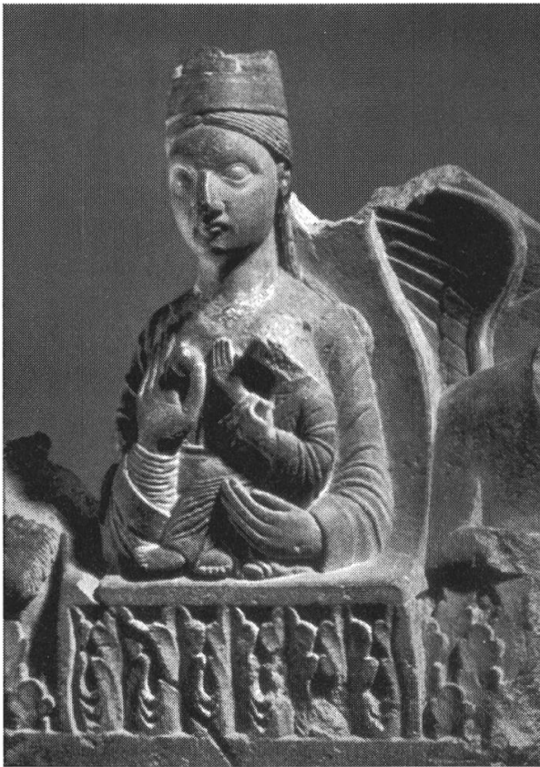
Figure 5. Madone de Siegburg (Cologne, Schnötgen-Museum)