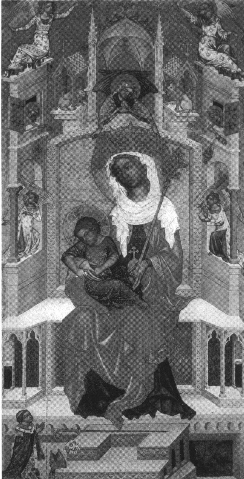
Figure 8. Madone de Kladsko (Berlin, Staatliche Museen, Bohème, v. 1350)