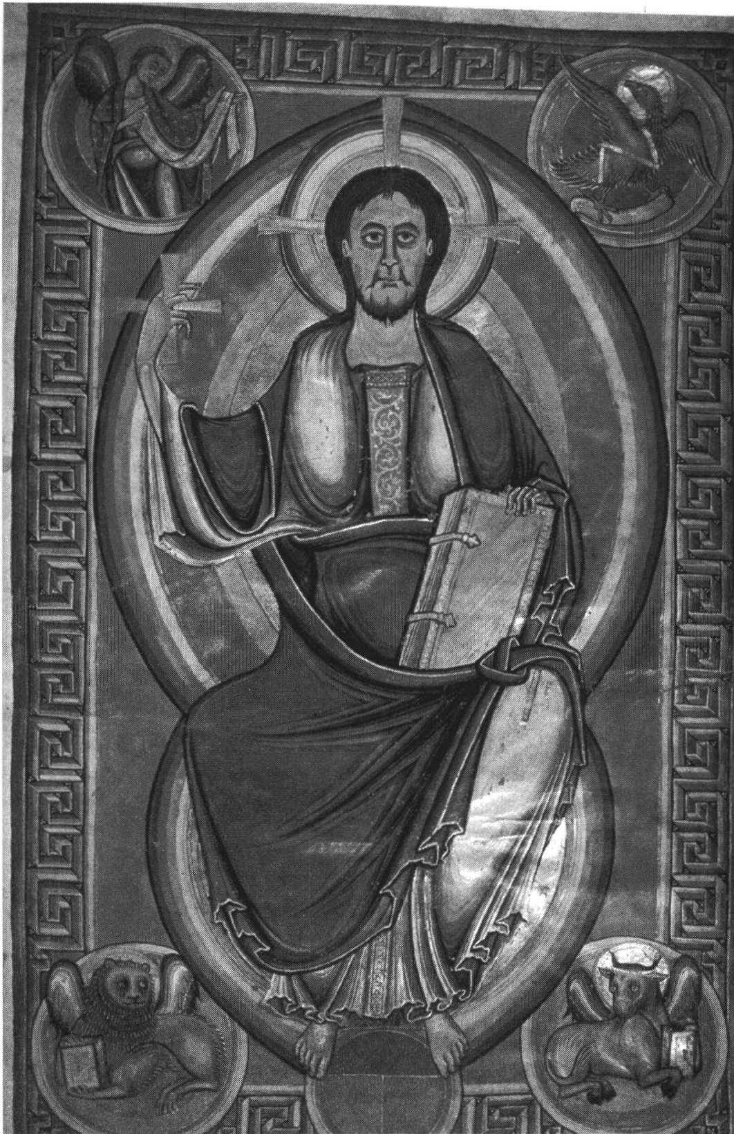
Figure 10. Christ en majesté (Bible de Stavelot, Londres, British Lib., add. ms. 28107, fol. 136r.)