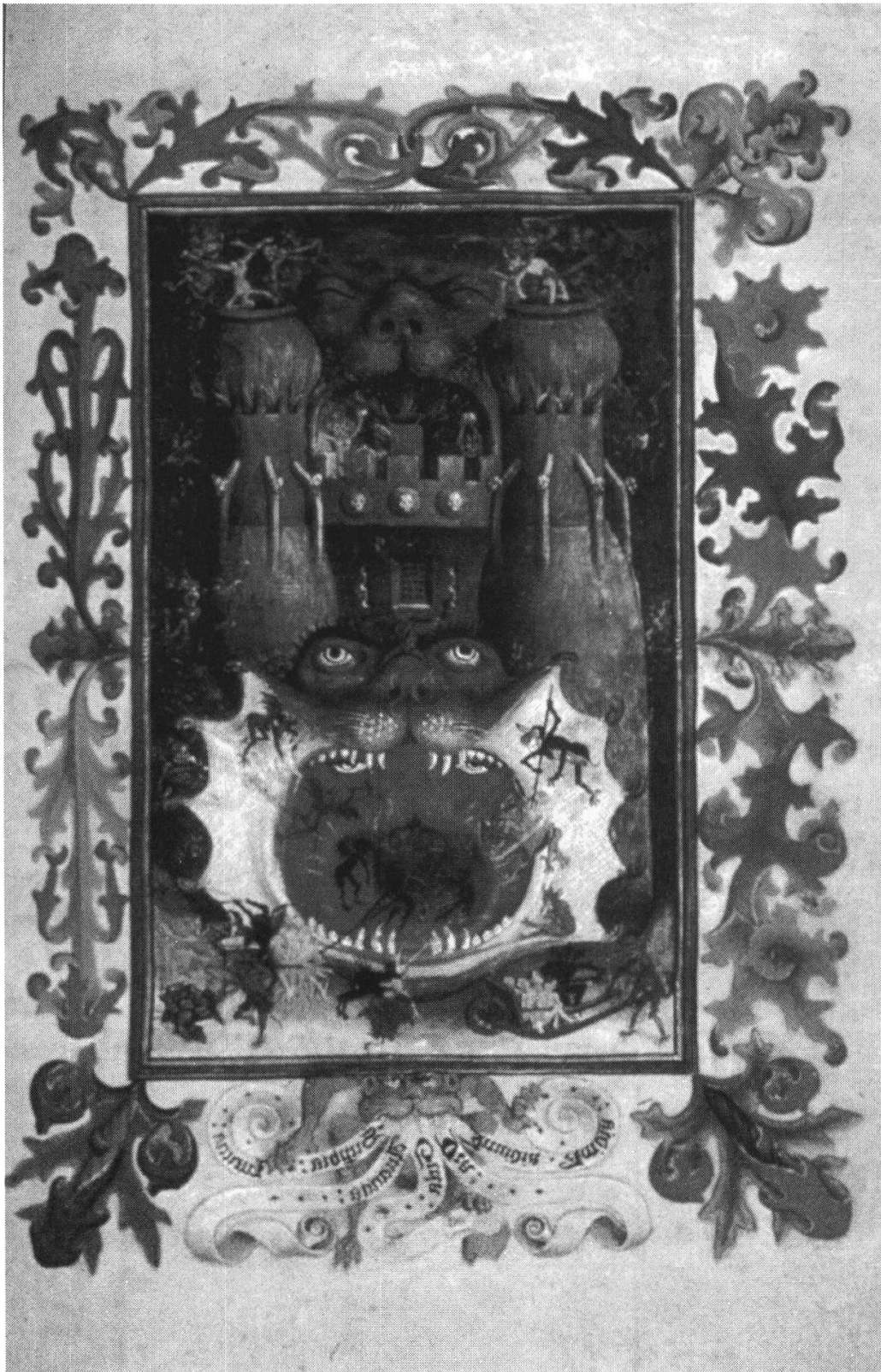
Figure 12. Gueule d'enfer (Livre d'Heures de Catherine de Clèves, New York, Guennol coll., fol. 168v.)