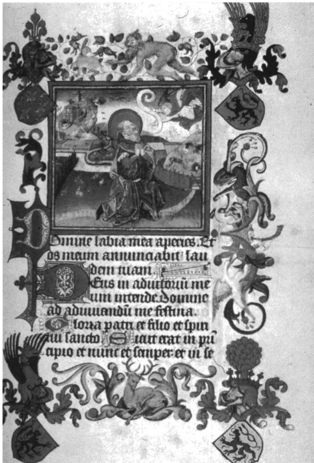
Figure 7. Annonce à Joachim (Livre d'Heures de Catherine de Clèves, New York, Guennol coll., fol. 2r.)