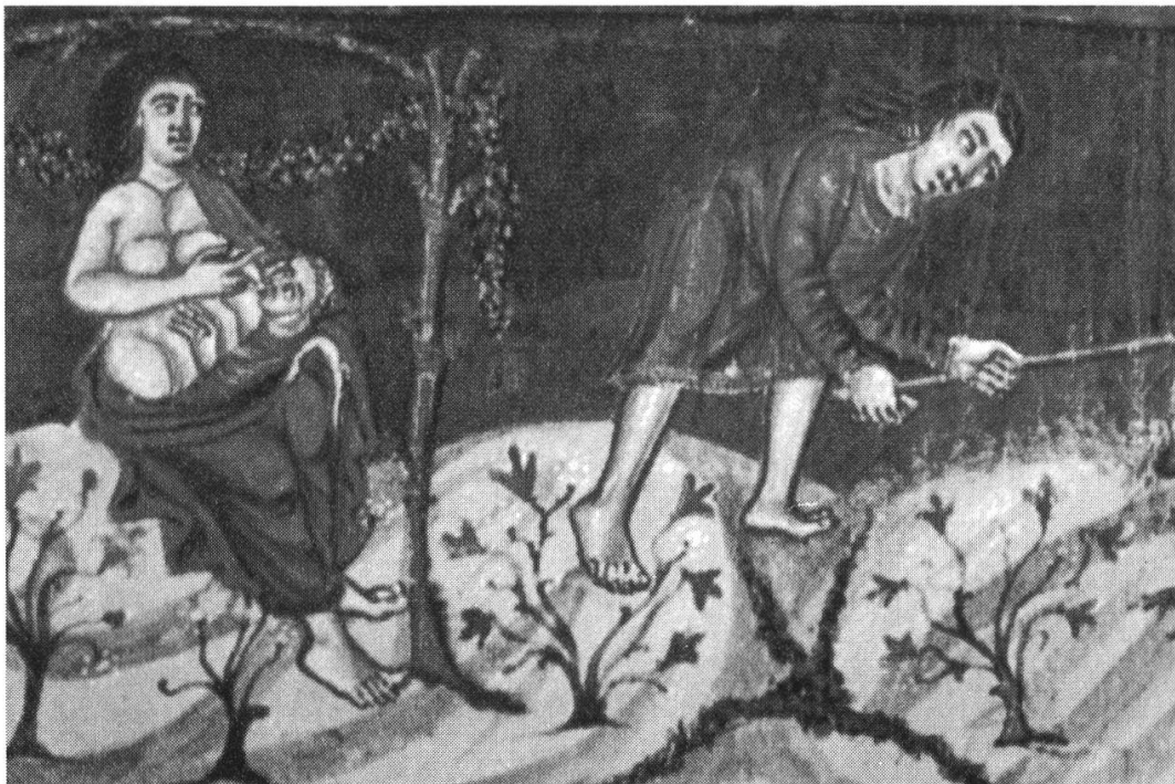
Figure 6. Détail du Frontispice de la Genèse (Bible de Moutier-Grandval, Londres, British Lib., add. ms. 10546, fol. 5v.)