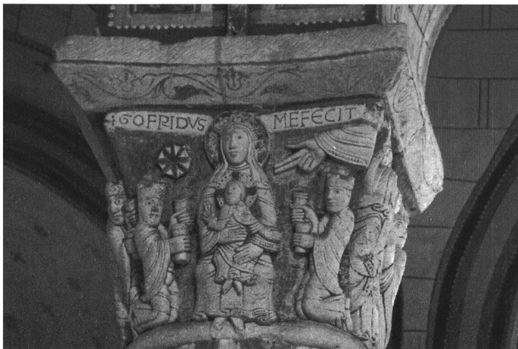
Figure 3. Adoration des mages , chapiteau de l'église Saint-Pierre à Chauvigny