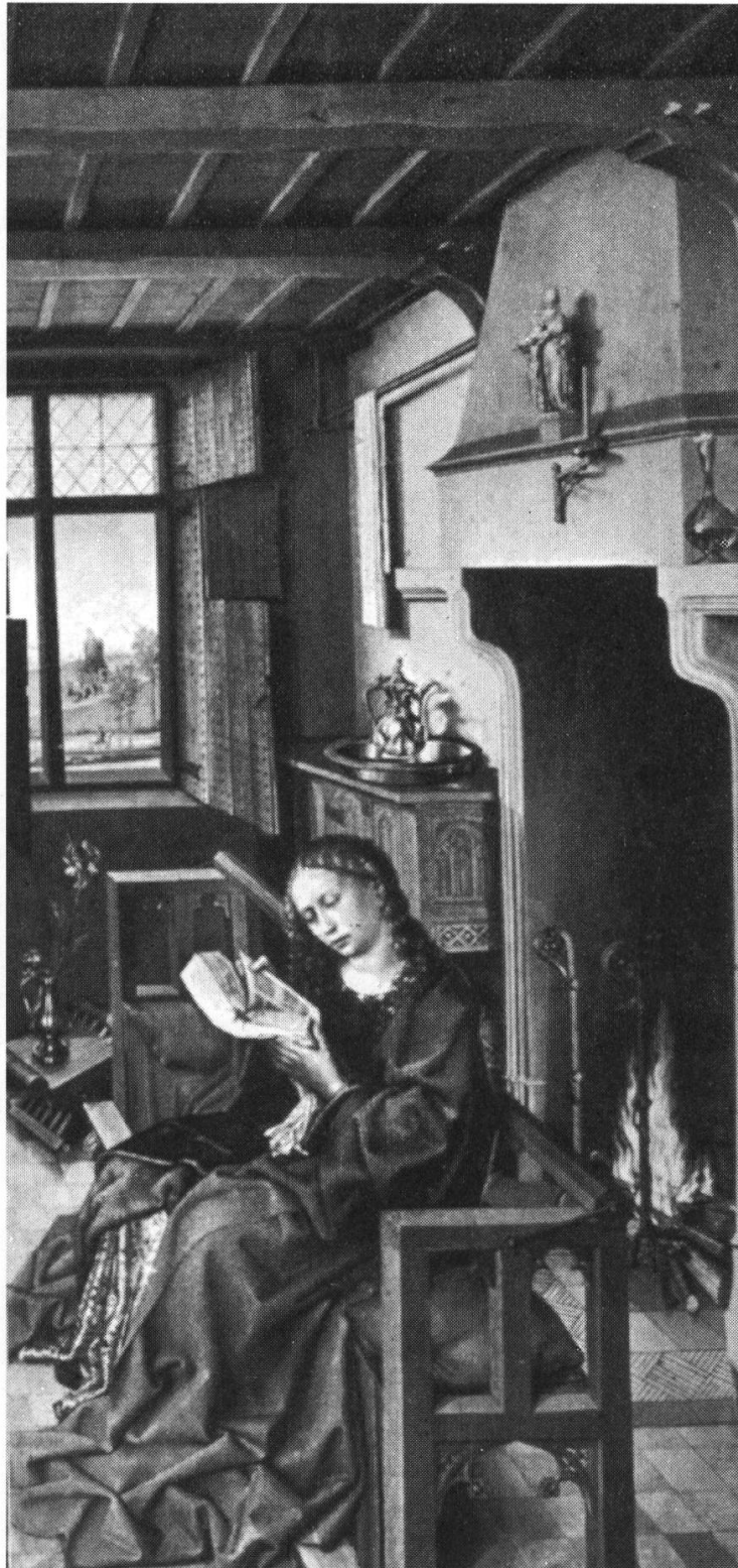
Figure 13. Robert Campin, Sainte Barbe (Retable Werl, Madrid, Prado)