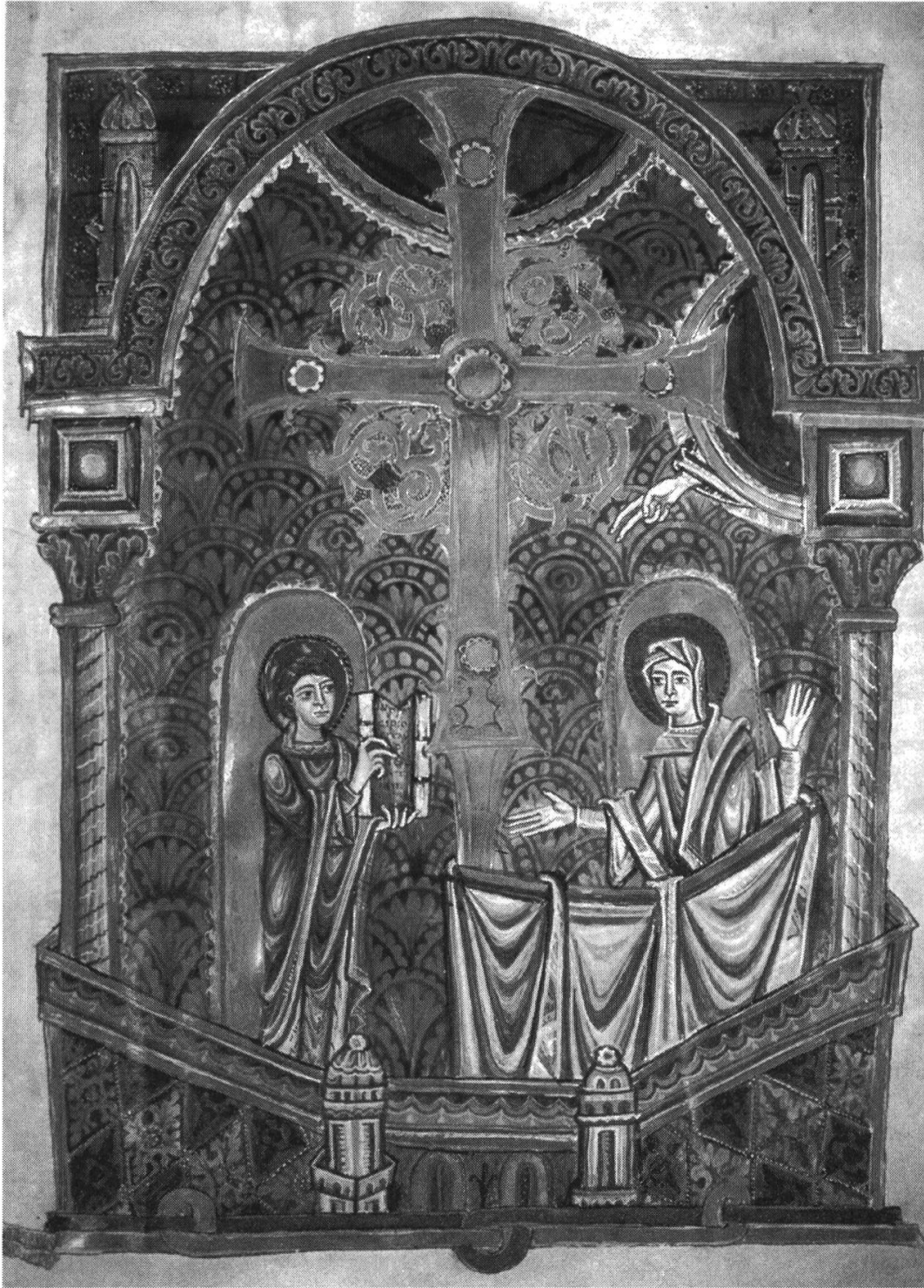
Figure 9. Frontispice (Bible de Bernward, Hildesheim, Trésor de la cathédrale, fol. 1r.)