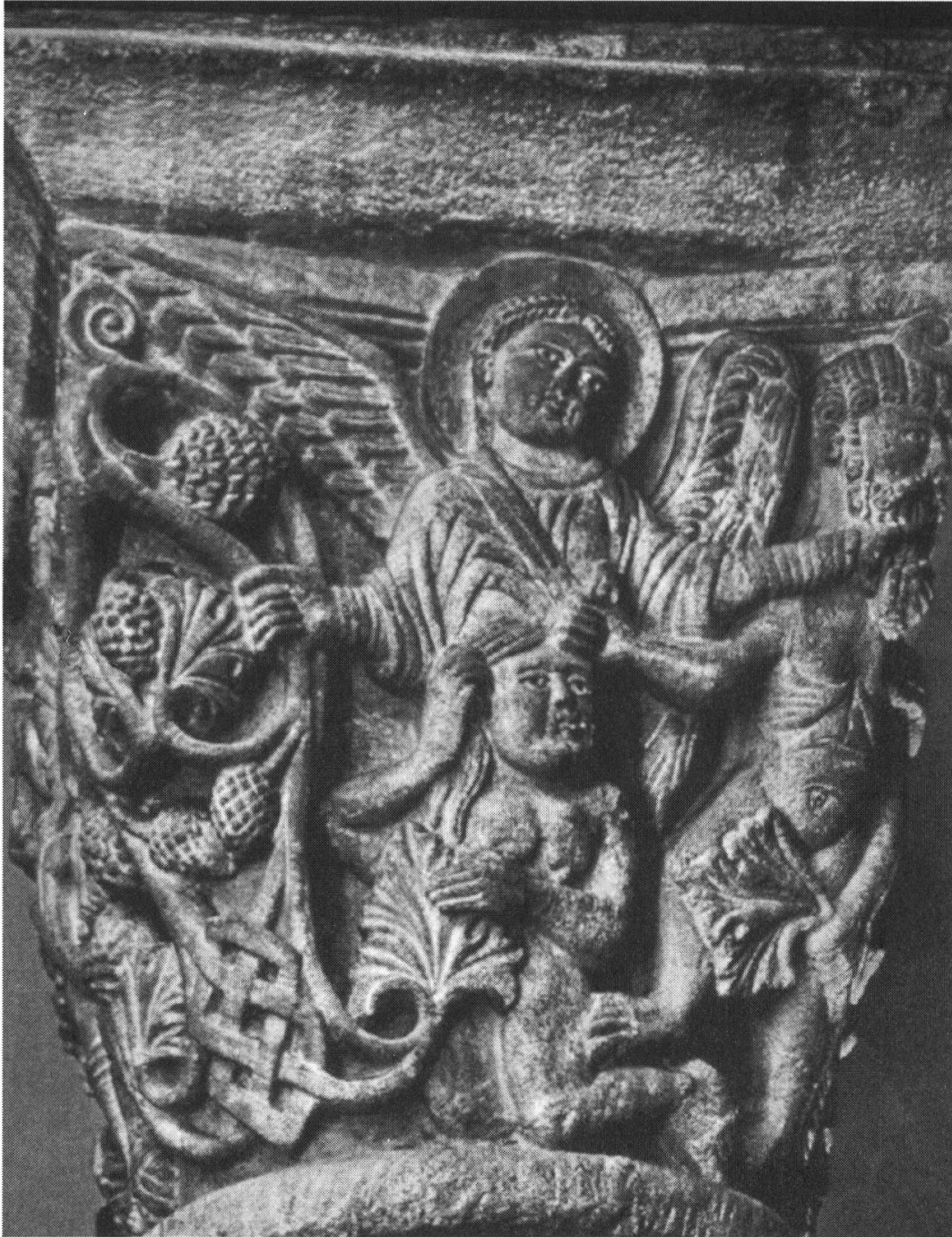
Figure 11. Expulsion d'Adam et Eve (Chapiteau de Notre-Dame-du-Port à Clermont-Ferrand)