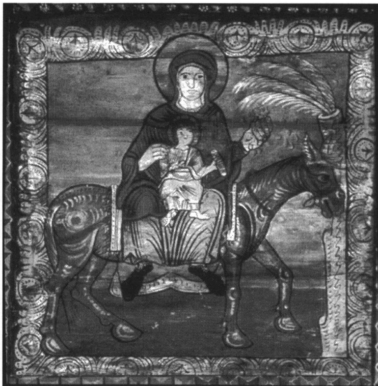
Figure 2. Fuite en Egypte (Zillis, plafond de l'église)