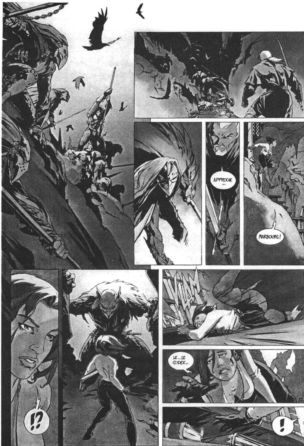
Fig. 5 ( Le Troisième Testament , t. 2, p. 24)

l'heroic fantasy n'est donc pas sans en venir à influencer notre représentation « réaliste » de son monde de référence privilégié : le Moyen Âge serait-il en passe de basculer tout entier dans l'imaginaire qu'il nous a fourni ?