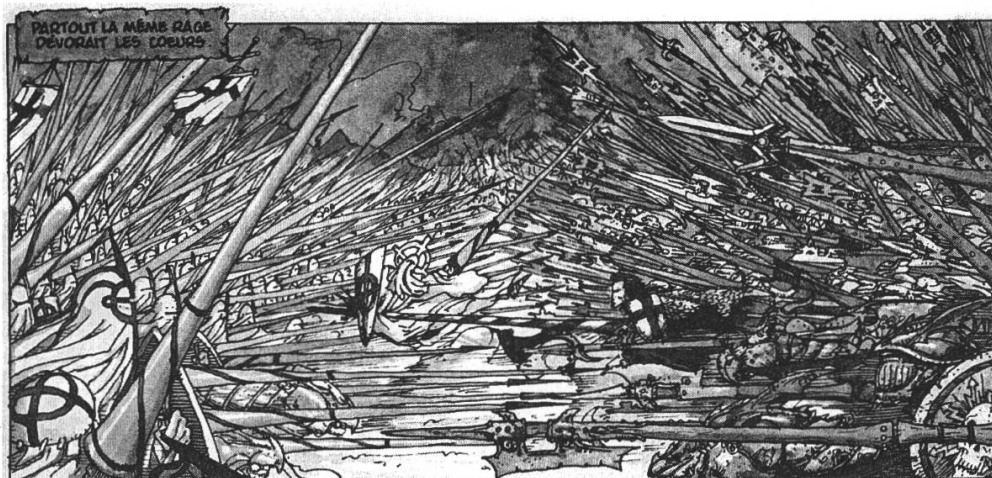
Fig. 3 ( Les Chroniques de la Lune noire , t. 1, p. 46)

Mais, plus encore que des armées, ces deux camps ont des Héros — ou des monstres, c'est selon. Guerriers légendaires et invincibles au combat, valant à eux seuls plusieurs dizaines de combattants réguliers du camp d'en face, ils sont une figure classique des grandes batailles qui se veulent épiques 38 .