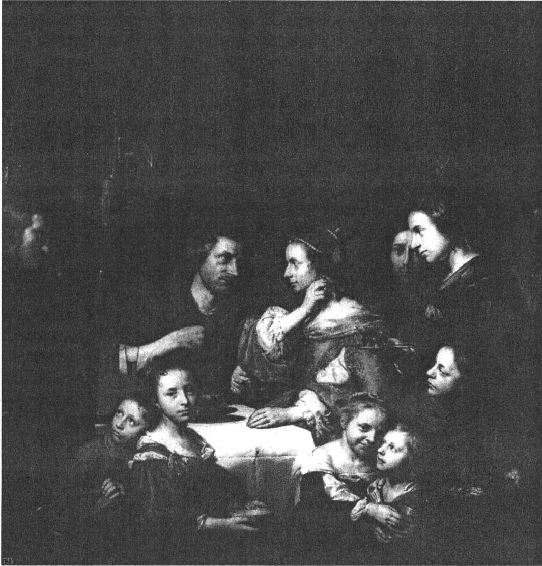
Fig. 3. Jan de Bray, Le Banquet de Cléopâtre , 1652-1656, huile sur toile, 170,2 x 166,4 cm, Hampton Court, collections royales.