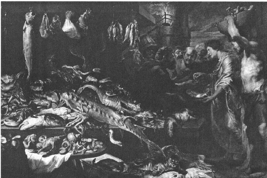
Fig. 7. Frans Snijders (et Anton van Dyck), Marché aux poissons , huile sur toile, 253 x 375 cm, Vienne, Kunsthistorisches Museum.