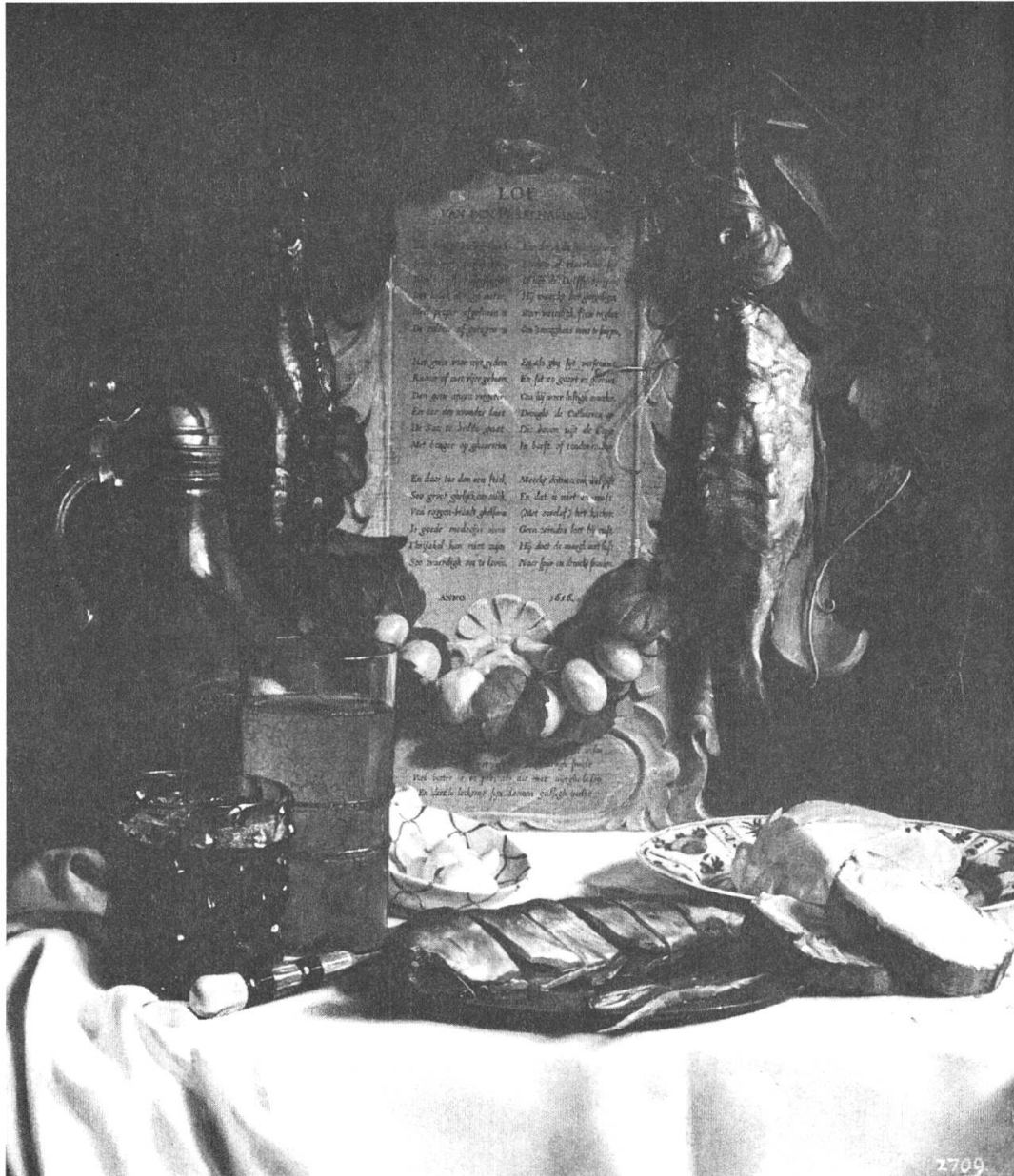
Fig. 1. Joseph de Bray, «Éloge du hareng mariné», 1656, huile sur bois, 57 x 48,5 cm, Dresde, Gemäldegalerie Alte Meister.