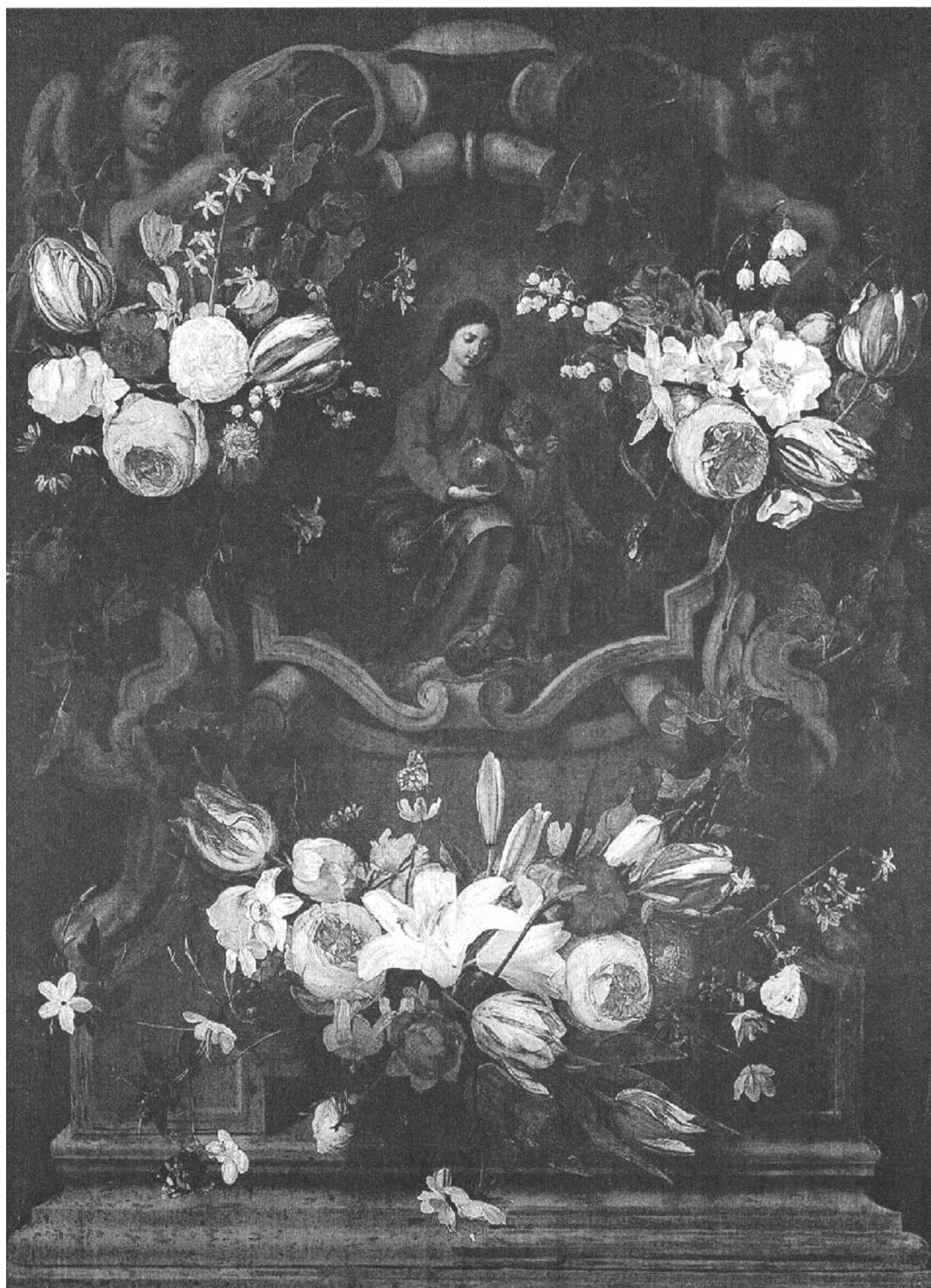
Fig. 8. Daniel Seghers, Vierge à l'enfant, entourée de guirlandes de fleurs , huile sur cuivre, 197,5 x 79,5 cm, Gand, Musée des Beaux-Arts.