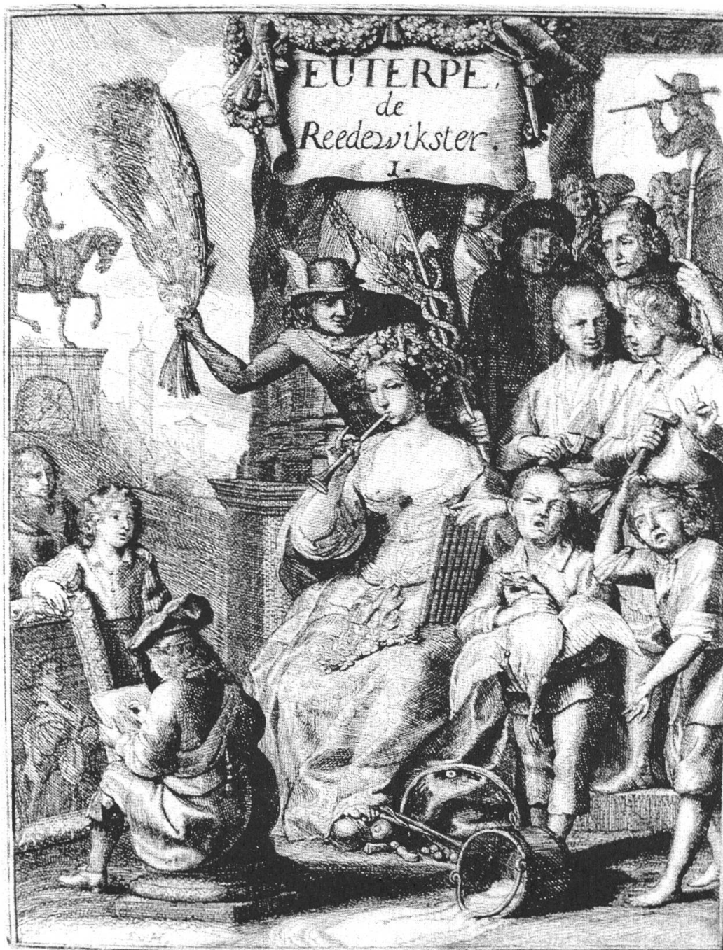
Fig. 5. Samuel van Hoogstraten, Frontispice du livre I (Euterpe) , in Inleyding tot de hooge schoole der schilderkonst (Rotterdam, 1676), en face de la page 1.