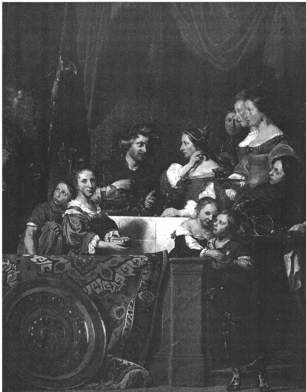
Fig. 4. Jan de Bray, Le Banquet de Cléopâtre , 1669, huile sur toile, 249 x 190 cm, Manchester (New Hampshire), The Currier Gallery of Art.