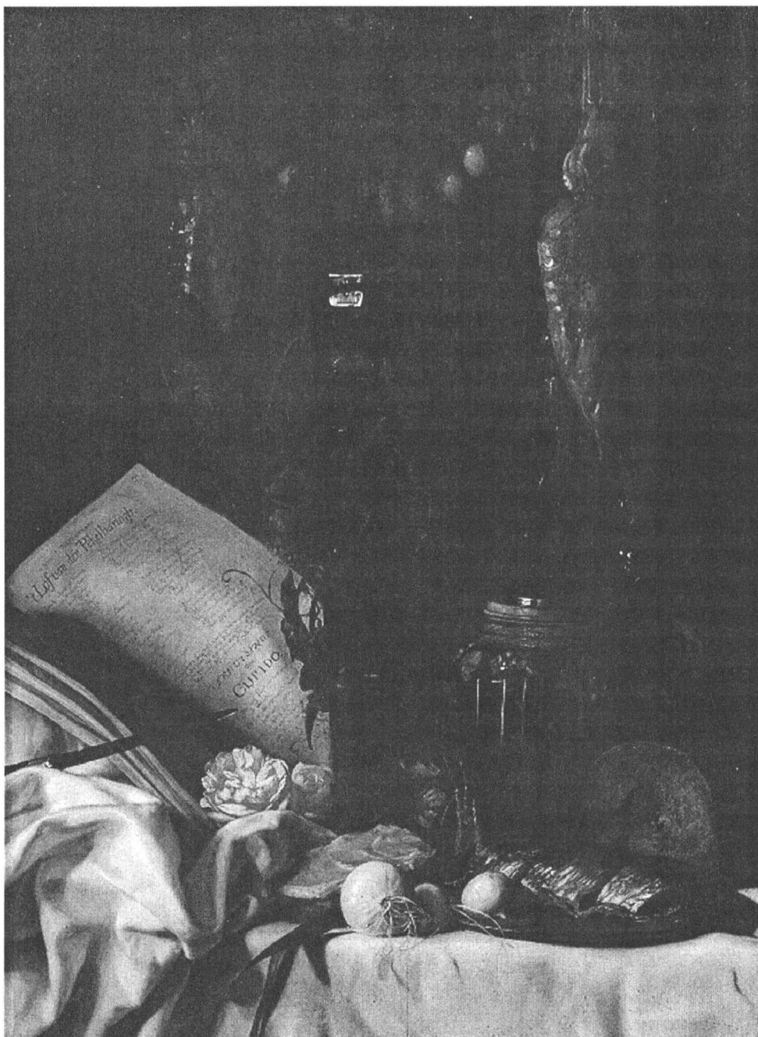
Fig. 6. Joseph de Bray, «Éloge du hareng mariné», 1657, huile sur bois, 67 x 49 cm, Aachen, Suermondt Ludwig Museum.