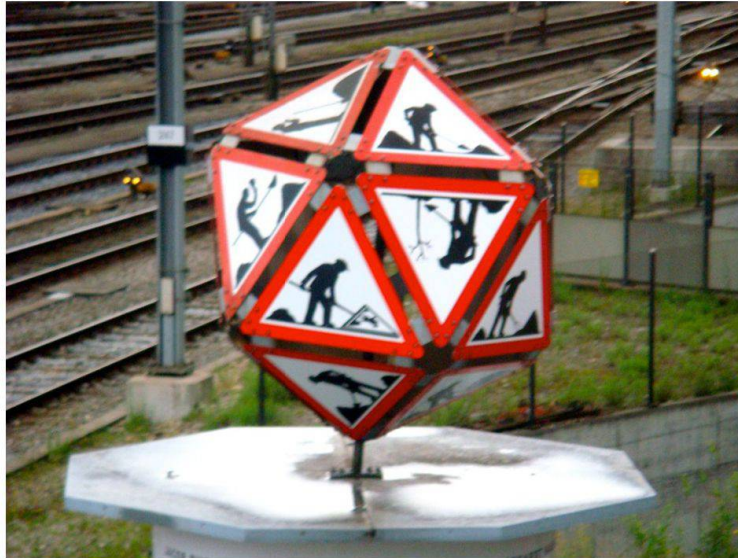
Abb. 3 Ein Ikosaeder \{3, 5\} beim Bahnhof SBB Basel, Juni 2010.

Mit Hilfe der Eulerschen Polyederformel und mit kombinatorischen Relationen zwischen den Zahlen a_i und p_j für P_{\text{reg}} \subset \mathbb{E}^n , wie etwa p_2 a_0 = 2a_1 = p_1 a_2 für n = 3 , erhält Schläfli durch Induktion folgende uns heute wohlbekannte Tabelle: