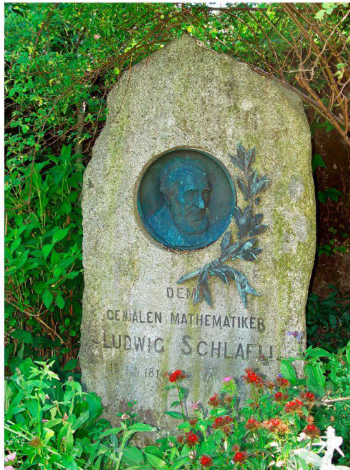
Abb. 5 Dem genialen Mathematiker Ludwig Schläfli, Inschrift auf dem Grabstein in Heimiswil, Juni 2010.

Wissen beherrscht und unter den zeitgenössischen Mathematikern kann man ihm nur Wenige, was die Mannigfaltigkeit der durchforschten Gebiete anbetrifft, an die Seite stellen.