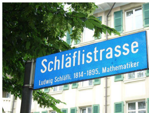
Abb. 4 Die Schläflistrasse in Bern, Juni 2010

Schläfli erfährt nun auch zunehmend und zahlreich Ehrungen aus dem In- und Ausland. Im Jahre 1863 wird ihm die Ehrendoktorwürde der philosophischen Fakultät Bern verliehen.