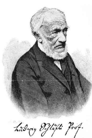
Abb. 1 Stich mit Portrait von Schläfli (Reproduktion aus der Graphischen Sammlung der Schweizerischen Nationalbibliothek in Bern).

Aus Anlass des 100-jährigen Bestehens der Schweizerischen Mathematischen Gesellschaft soll an Ludwig Schläfli erinnert werden, der zu den ganz grossen Schweizer Mathematikern gehört. Es ist mir eine Ehre diese Aufgabe zu übernehmen. Ich stütze mich dabei auf meine Antrittsvorlesung „Der Mathematiker Ludwig Schläfli (15.01.1814–20.03.1895)“ vom 2. Februar 1996 im Rahmen der Habilitation an der Universität Bonn, die anlässlich des 100. Todestages von Schläfli entstanden ist. Der Vortrag ist in den DMV-Mitteilungen 1996 veröffentlicht worden (cf. [5]) und wird hier mit deren Einverständnis etwas modifiziert und verkürzt wiedergegeben. Im Folgenden möchte ich vor allem die beeindruckende Persönlichkeit des Wissenschaftlers Ludwig Schläfli hervorheben und dazwischen einen kleinen Einblick in Teile seines Schaffens geben.