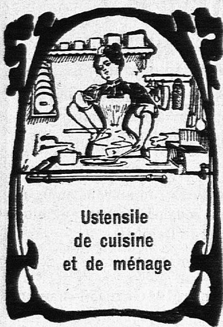
Ustensile de cuisine et de ménage

FRANCILLON & C ie RUE ST-FRANÇOIS, 5, ET PLACE DU PONT LAUSANNE