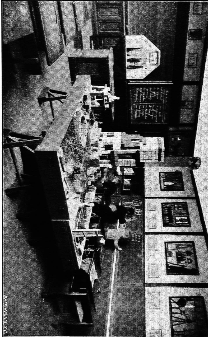
Classe primaire de l'école de Saventhem.

de premier plan. Les marionnettes, découpées dans du carton et suspendues à des fils, sont souvent confectionnées par les élèves de la classe, ou par ceux d'une classe supérieure. Pendant notre visite, deux écoliers plus âgés sont