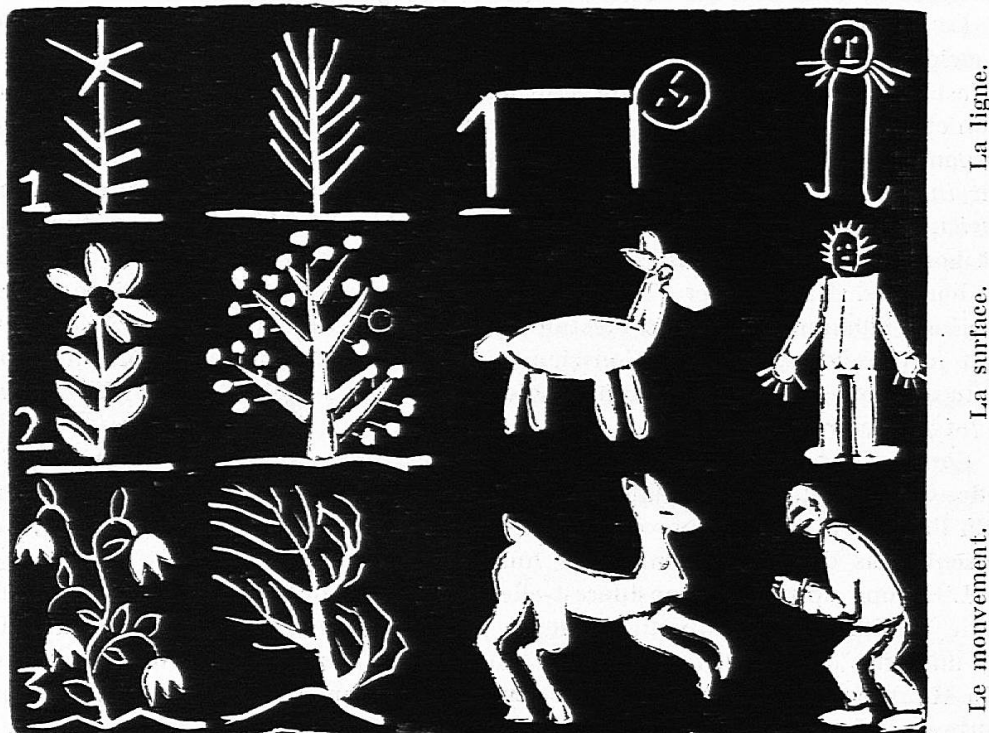
Les trois étapes du développement artistique de l'enfant.

Dans ses premiers essais, l'enfant représente n'importe quelle figure par des lignes (rangée 1). Plus tard, il comprend que les corps ont une certaine largeur ;